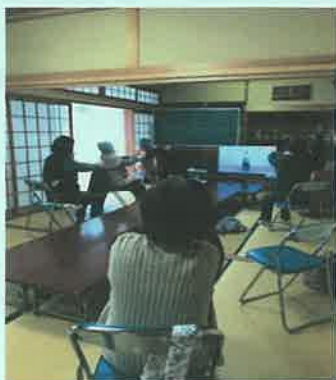
< こより会にておりひめ体操 >

2月5日には民生委員・協力委員様交え練習を行いました。楽しいですよ！ 只今 会員募集中です。