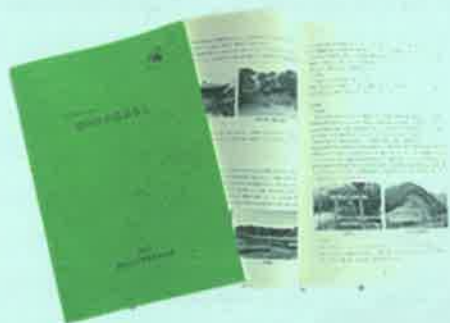
黒田庄の昔ばなし記録集

記録集については、黒っこプラザで無料配布(150部限定)しています。また、黒っこプラザで昔ばなしのパネル展示を4月30日までしております。ぜひ、こちらの方もご覧ください。