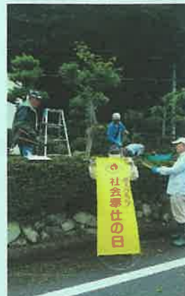
< 船町口駅にて >

会員有志で公民館にて毎月1回集まり、各人持ち寄りの米1合とワンコインで季節の食材を調達しお手製のお弁当を作り、皆さんと共に楽しく会食をし、おりひめ体操も行いフレイル予防に努めています。