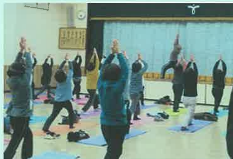
インドヨガ教室の様子

随時、インドヨガ教室の受講生を募集しておりますので、受講を希望される方は、下記へお申し込み下さい。