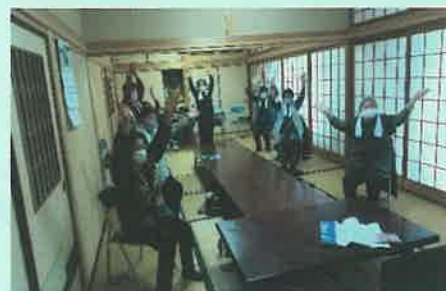
< おりひめ体操会グループ >