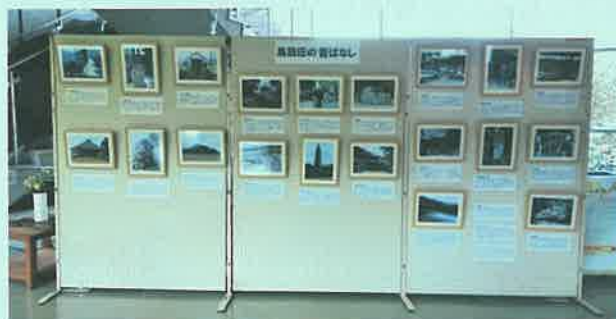
黒っこプラザにて昔ばなしのパネル展示