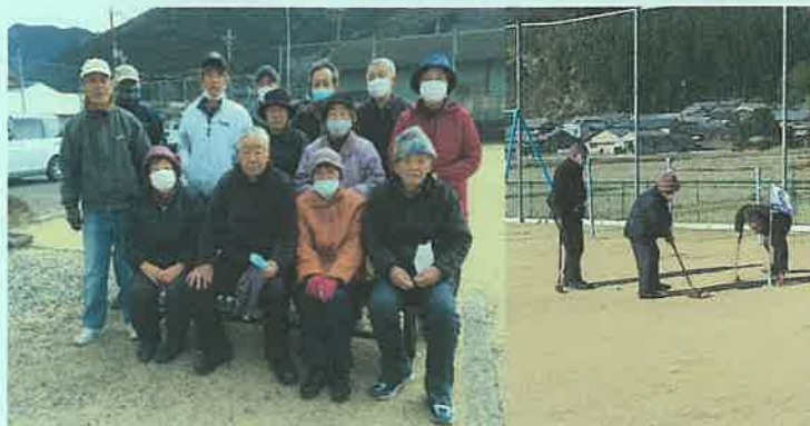
< 民生委員を交えグラウンドゴルフ練習 >