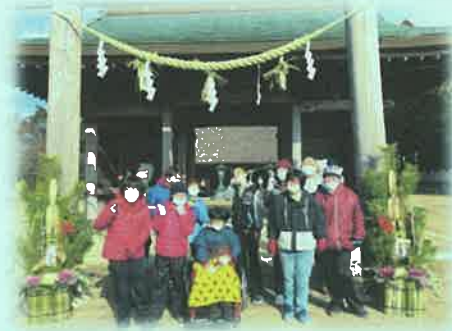
みんなで集合写真。ハイ！チーズ！