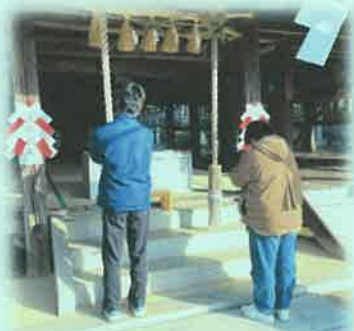
暮らしやすい年になりますように。