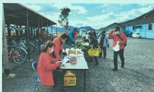
あつまっ亭感謝祭