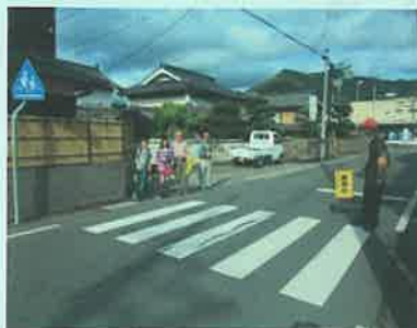
黒田庄子ども見守り活動

編集・発行 黒田庄まちづくり協議会 西脇市黒田庄町前坂2140番地 TEL 28-2121 令和4年1月15日発行