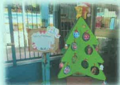
<保護者会作製アドベントツリー