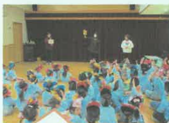
せつぶんクイズ♪「オニのパンツはどれでしょう?」

最後には鬼が降参して、仲良く握手!! 泣きながら「また来てね」とお願いする子もいました。お昼は節分メニュー、おやつには“おにまんじゅう”をいただきました。