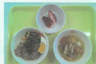
《節分メニュー》 ビビンバ かみなり汁 いちご 《おやつ》 おにまんじゅう