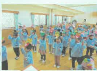
みんなでおどろう! 「おにのパンツ」