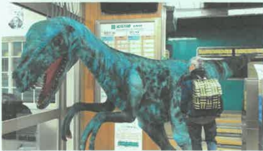
西脇市駅 恐竜:メガラプトル

このような楽しい企画を実施していただいているJR加古川線「西脇市駅～谷川駅間」を地域の足として、みんなで乗車して守って行こうではありませんか。