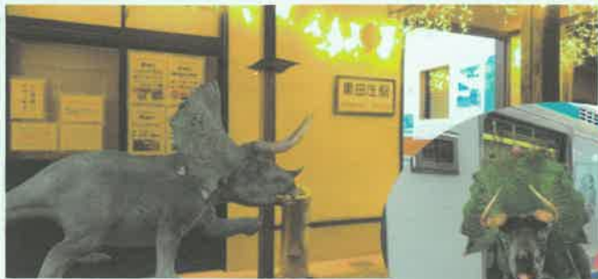
黒田庄駅 恐竜:トリケラトプス