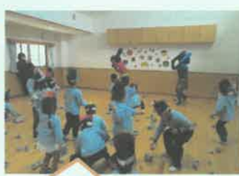
赤鬼、青鬼登場!! おには~そと!!