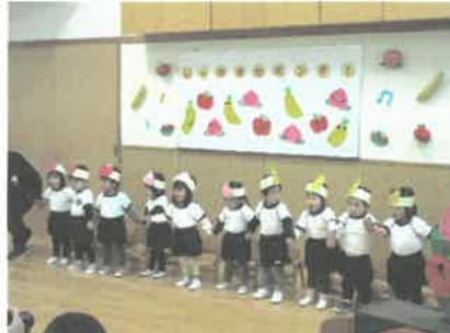
「じゃかすかポンチ」(1歳児)