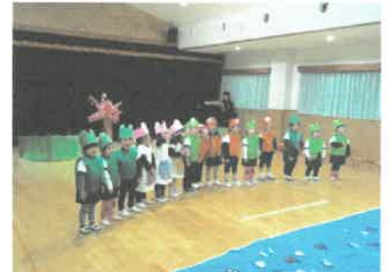
「999ひきのきょうだい」(2歳児)