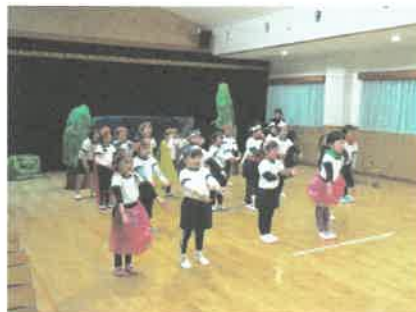
「めっくら もっくら どおんどん」(4歳児)