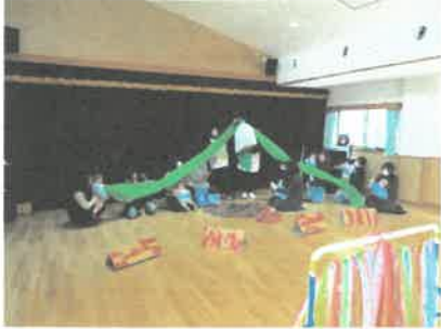
「おおきなかぶ」(0歳児)

27日(金)は、0歳児の保育参加日でした。親子でお話あそびを楽しみました。おうちの方と一緒に参加でき、穏やかな表情や笑顔が印象的でした。