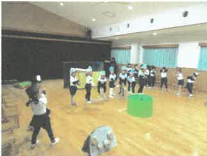
「おむすびころりん」(3歳児)