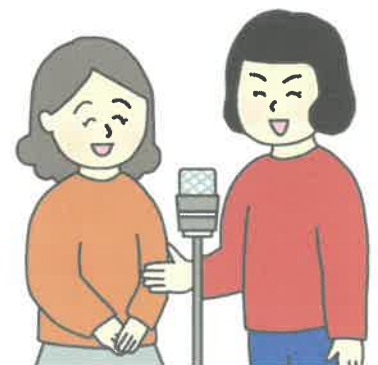
丹波篠山市在住の 「まるっち〜ず」さんの漫才 (画像はイメージです)