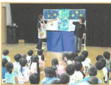
ペープサート♪ 「おいひめとひこぼし」