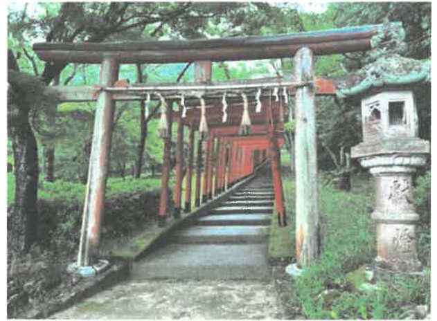
補修工事前 色褪せた大鳥居

最前列の大鳥居を含め、123本が並ぶ鳥居群は 近隣市町には見当たらず、稲荷参道周辺の樹木が茂 る一帯を「福谷公園」と称しているが、四季折々の風 景は絶景で近隣に並ぶものはないであろうと思われます。