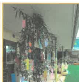
みんなの願い事が かないますように...