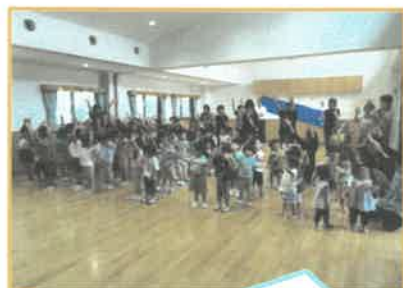
みんなで歌ったよ♪ "ささのはさ〜らさ〜♪"