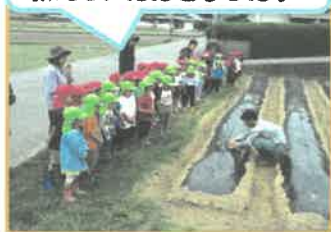
さつまいの苗の植え方を 教えていただきました♪

また、園内でも夏野菜を育てています!!5歳児は一人一鉢自分で選んだ野菜を購入し、植えています。毎日水やりを頑張り、ぐんぐん生長しています。