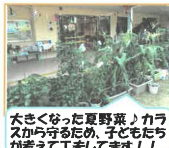
大きくなった夏野菜♪カラスから守るため、子どもたちが考えて工夫しています!!