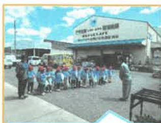
JAまで野菜の苗を買い に行ったよ!