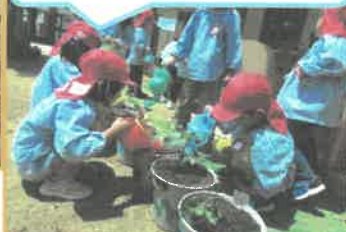
おおきくなあれ!! はやく食べたいなあ...