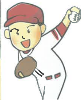
親善ソフトボール大会の様子