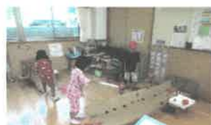
くまカントリークラブ♪ うまく入るかなあ...