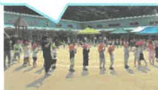
わくわくボールすくい！！