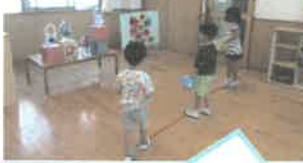
的あて♪がんばるぞ！！