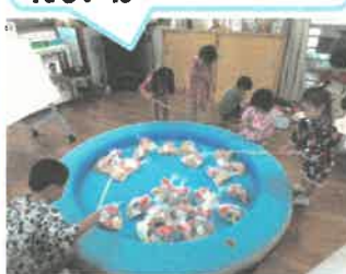
お菓子作り♪なかなかつれないね...