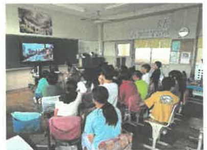
現地の小学生とオンライン授業