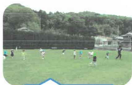
グラウンドひろいわ～