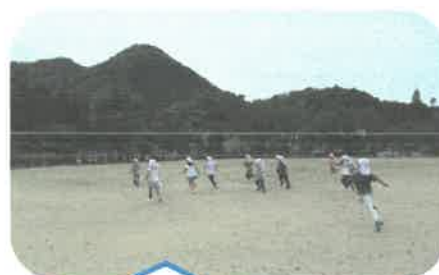
けいどう鬼ごっこ!! まで～