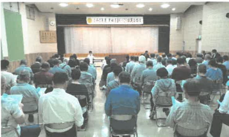
昨年の総会の様子