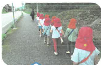
がんばって歩くぞ!!