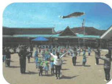
ダンス♪こいのぼりキッス

5月2日、青空の下、こどもの日の集いを行いました。まず遊戯室で、歌を歌ったり、こいのぼりのお話を聞いたりしました。その後は、こいのぼりが元気に泳いでいる園庭へ!! 年長さんが先生となり、みんなでダンス♪こいのぼり目指してかけっこも楽しみました。