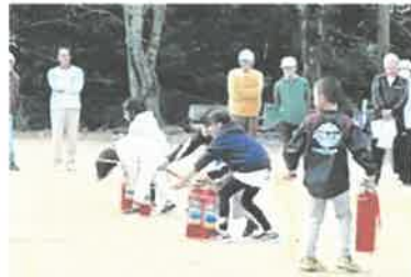
消火活動実践中の様子