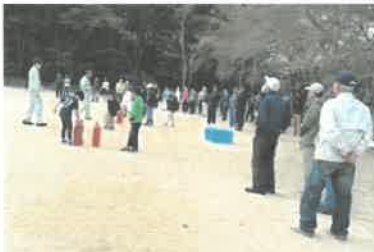
消火器の取り扱いの説明中の様子

これからますます乾燥する時期になります。皆さまくれぐれも火の取り扱いには気を付けてくださいね。