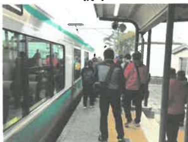
歴史ハイキング JR黒田庄駅出発