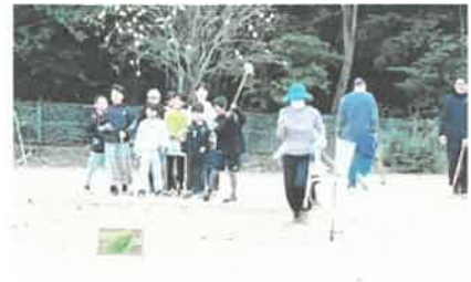
グラウンドゴルフ大会の様子

その後、西脇市の防災安全課の方にお越しいただき、火災時の初期消火について説明を受け、消火器の取り扱いについて実践をしました。“火事だー！”と叫びながら火の出ている想定で消火器を使って火を消す訓練をしました。子どもも大人も実践することで火の消し方を、そして火の怖さが分かり、良い時間となりました。