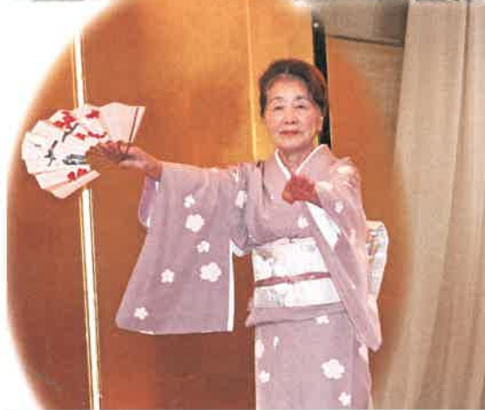
熊本さん(2区) 48歳から日本舞踊を始められ 40年近く週1回お稽古されています。