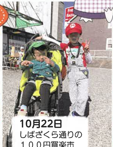
10月22日 しばざくら通りの 100円買楽市