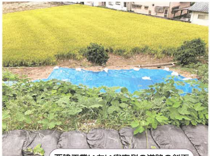
西脇工業いちい寮東側の道路の斜面

このような災害が起こった時どのように対処すればよいのでしょうか？浸水被害にあわれた住民の方の行動をお聞きしました。