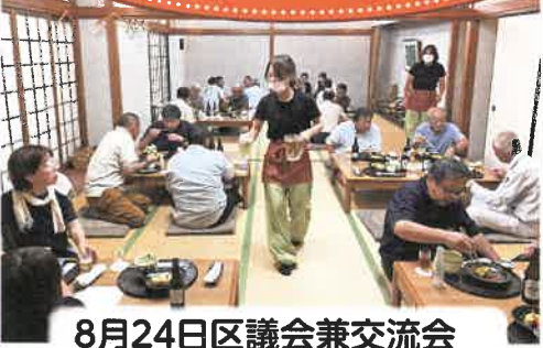
8月24日区議会兼交流会 2022年4月の役員就任以来初の交流会です。