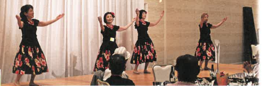
緑風台サークル「マハロ」敬老会対象者もおられます