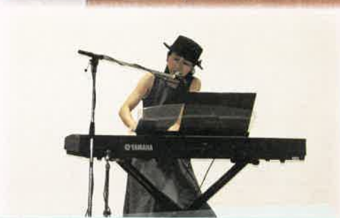
AOIさん「ヘソノオノウタ」作曲作詞