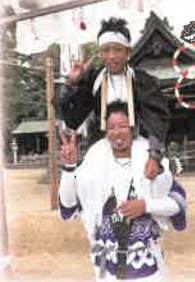
14:20 境内では 足を地面につけて はいけません。