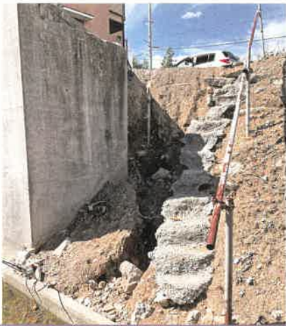
やながわ酒店南側の勾面 翌日土嚢が積まれ応急処置がされました。

このような災害が起こると想定されていませんか？野村町内で土砂災害が発生したのは初めてのことでした。