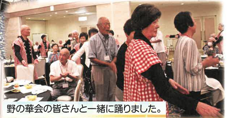
野の華会の皆さんと一緒に踊りました。