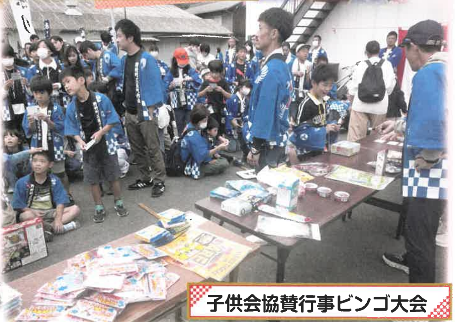
子供会協賛行事ビンゴ大会