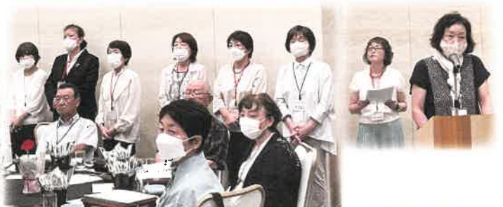
女性の会の皆さん、準備から進行すべてお世話になりました。