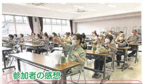
参加者の感想 人に来てお話ができたときは寝つきがいいです。フレイルにもならないしね。毎回ためになるお話、レクリエーションもあり、楽しみにしています。