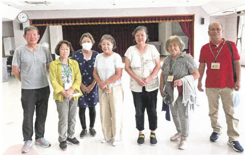
各區の民生委員さんです。他民生協力委員さんが各區2名おられます。