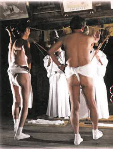
19:00 白装束姿が立り者 裱着用者が相撲の行司 ふんどし姿が潜水夫