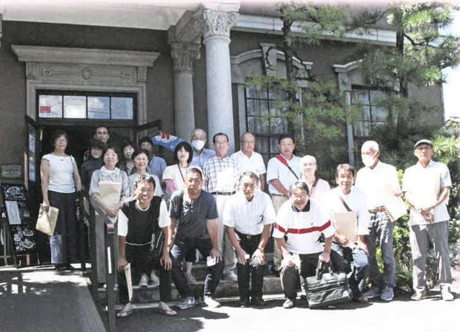
協議会事務所がある城西浪漫館（国登録有形文化財）の前で