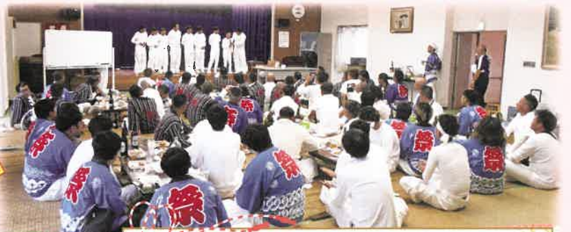
16:40 帰路は小雨になりましたが、 無事公民館まで帰ってきました。