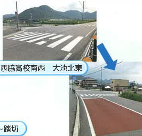
西脇高校南西 大池北東

これは野村町が市に要望を出した結果、通学路であるので皆さんの注意喚起を促すため、道路に色が塗られたものです。