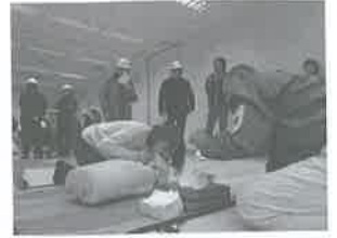
人工呼吸法とAED取扱い