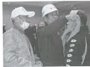
ケガをした時の三角帯

雨天のため、会場を西脇区会館に移し、初期消火、応急処置AEDの訓練を実施。今回は、消防団員が各町から会館までの避難誘導と安全管理を行い200名の方々が訓練に参加されました。