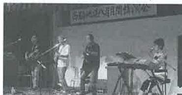
「リラックス」バンドの「人権」を歌詞にした歌を披露