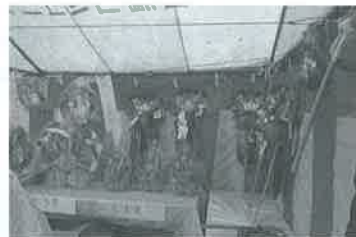
今年も西脇区で吉兆(福笹・福熊手・福箕など)を手作りし、販売しました。