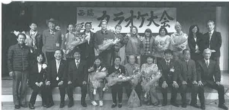
区内10町から18名の方が出場され、自慢のノドを披露されました。