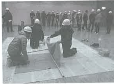
毛布を利用した応急タンカ