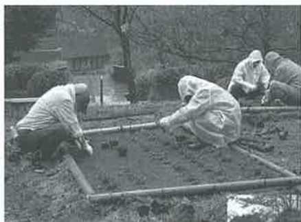
童子山 しばざくら花壇