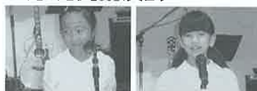
小・中学生の人権作文