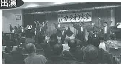
よさこいチーム(風火雷霆)