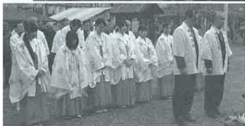
八幡神社宮司による神事(商売繁盛、商業振興祈願)