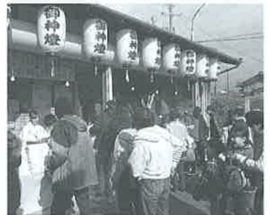
多数の参拝者で大賑わいの福引き