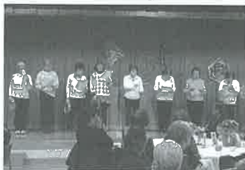
1月 会員による歌とおどり