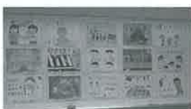
小学生のあいさつ運動ポスターをコミセンまつりで展示