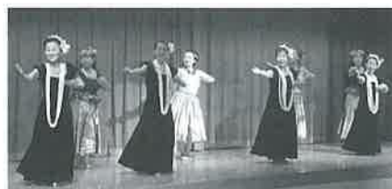
大正琴・舞踊、フラダンスetc…