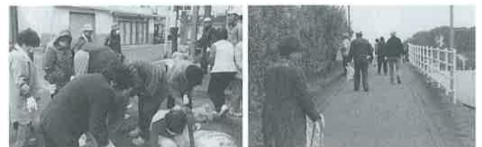
公民館前で分別作業