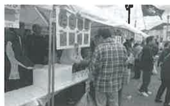
タコ焼き、カラあげ、焼ソバなどのコーナーには多く人が…すべて完売しました。