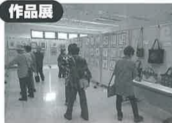
書・絵画・編み物など多くの力作が集まりました。