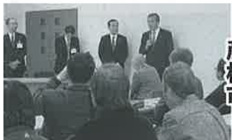
歓迎の久大保市長