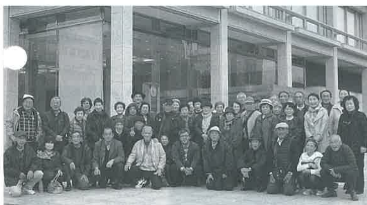
平和記念資料館前で