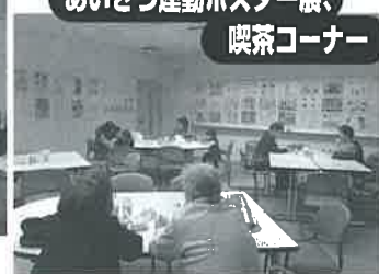
小学生のポスターと喫茶室