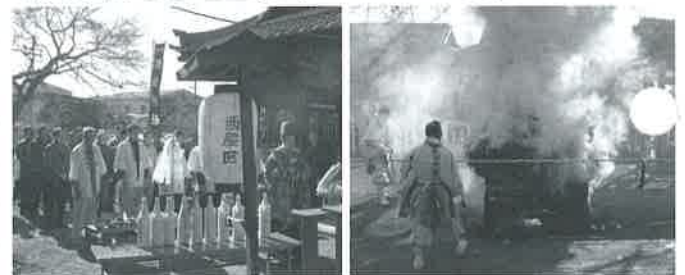
神事 火難即滅 産業振興 祈願