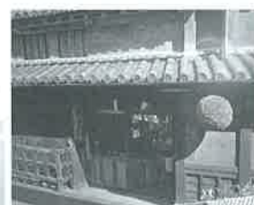
竹鶴酒造と町並み散策