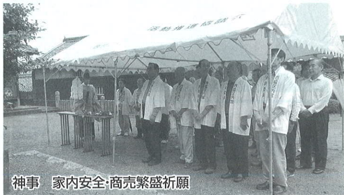
神事 家内安全・商売繁盛祈願