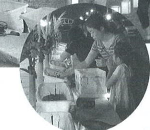
今年で20回目を迎えた夏の行事。お盆に仏をお送りするため、多くの方が参加されました。