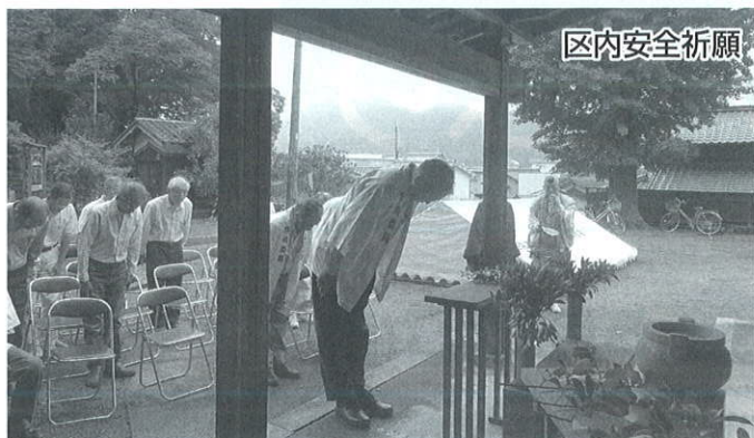
参列 正副町内会長 内宮委員代表 祈願 西脇両部講