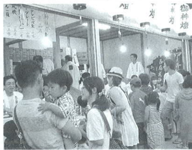
1600を超える景品が多くの方々に