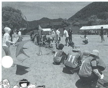
力が入った綱引き