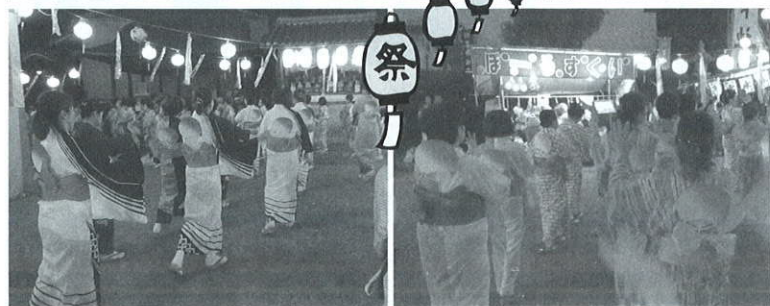
130人を超える区内婦人部の手おどり