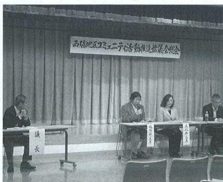
年間行事を発表する各部長