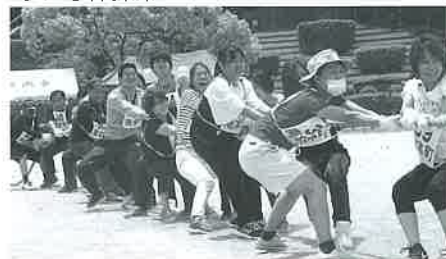
さあ みんな一気に引くよ〜