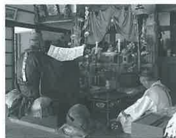
両部講の発声にあわせて般若心経等を合掌