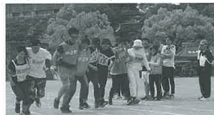
右左、右左、いちに、いちに...