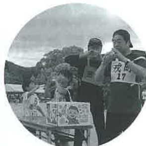
ラムネの一気飲みはつらい