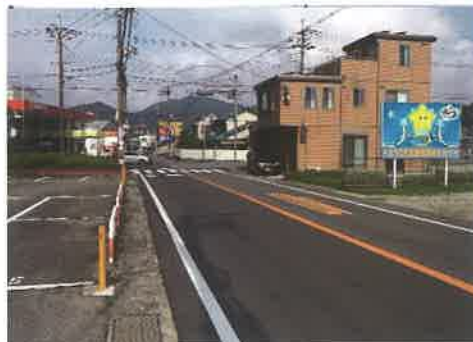
• 東西道路（上野工区） →県事業で今年度から事業着手