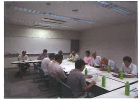
世話役会を中心に検討をしています