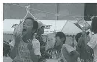
うまくくわえられない!