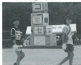
息ぴったりでしょ。