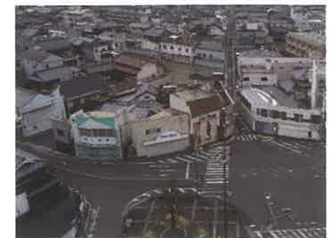
• 南北道路と東西道路の交差点付近 →県事業と一体となって施行出来るよう検討を進めます！