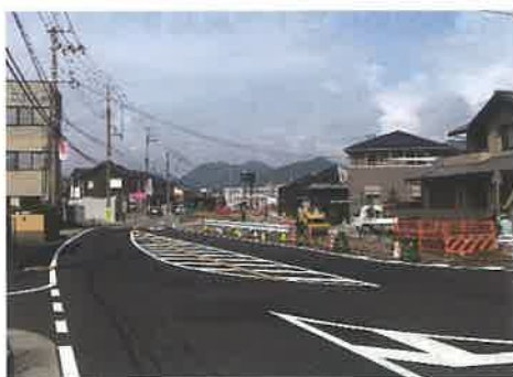
• 工事が進む東西道路（下戸田工区） →11月ごろ完成予定