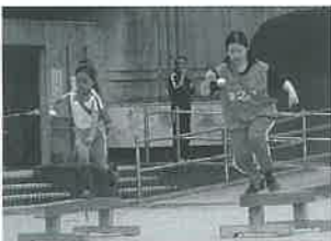
バランスがいい。お上手!