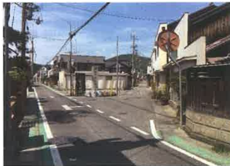
地域資源のY字路はどうする！？