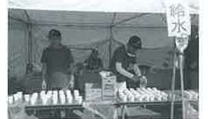
ご協力ありがとうございました。