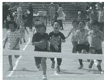
がんばれ! がんばれ! みんな速いなあ〜