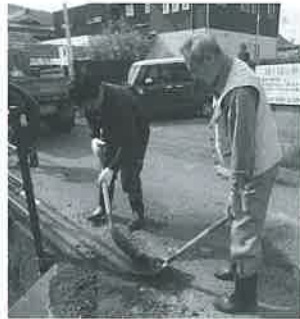
区内のみなさん ごくろうさまでした