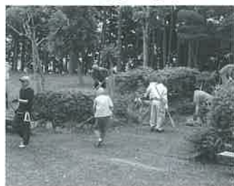
杉原川清掃(年2回)、童子山清掃(年5回)