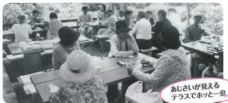
あじさいが見えるテラスでホッと一息