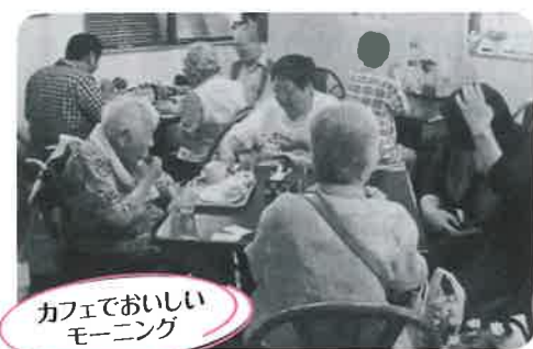
カフェでおいしいモーニング