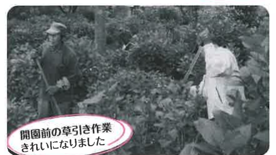
開園前の草引き作業きれいになりました