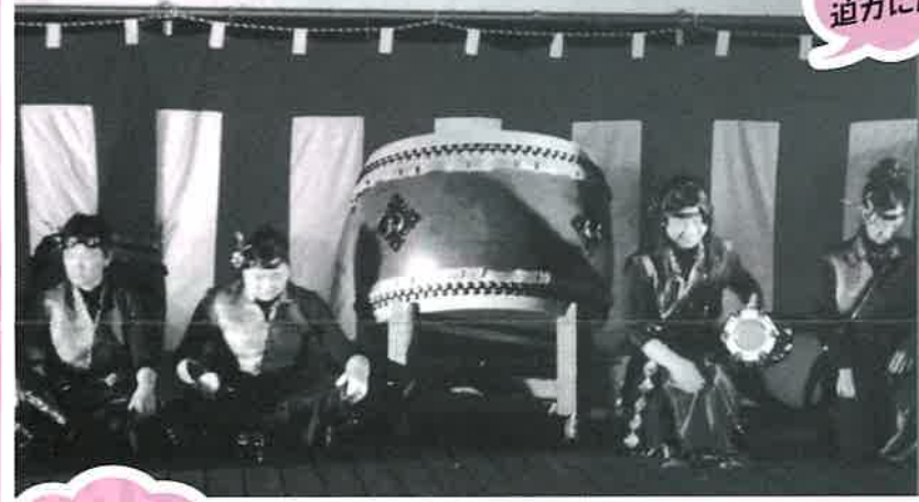
女性だけのメンバーの迫りに脱帽