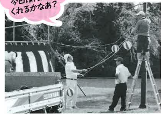
天気よし!! 今日は何人来てくれるかなあ?