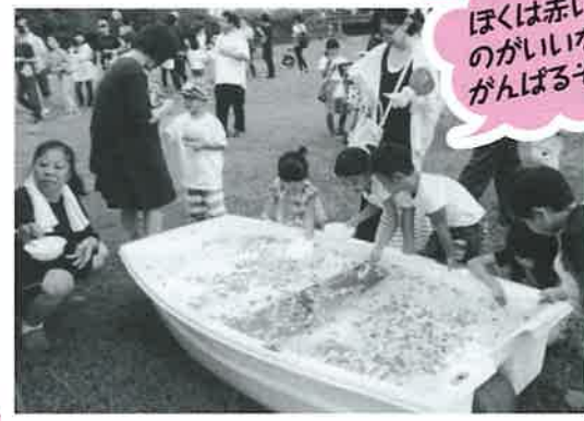
ほくは赤いのがいいながんばるぞ!!