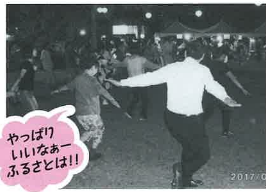
やっぱりいいなあーふるざとは!!