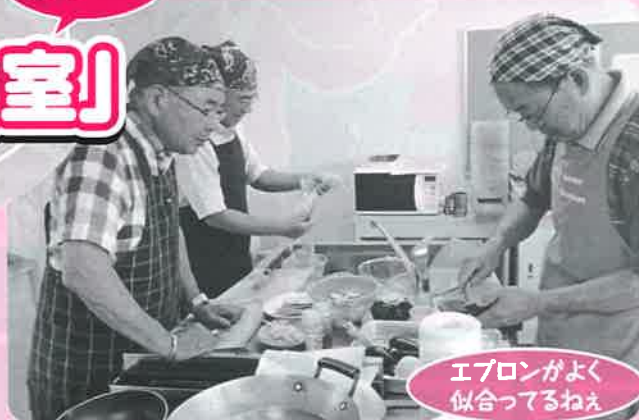
エプロンがよく似合ってるねえ