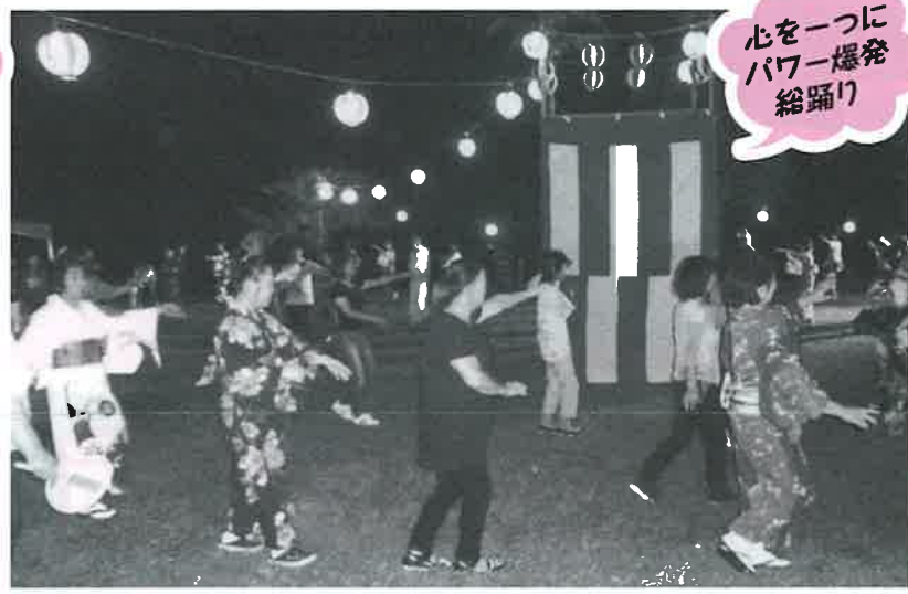
心をついにパワー爆発総踊り