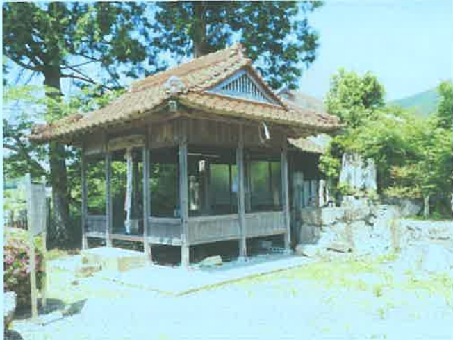
明楽寺町 きつね塚古墳

きつね塚古墳は、7世紀末～8世紀初頭、丘陵斜面に築かれた直径11m、高さ2.5mほどの円墳です。輝根塚教苑の境内にあり、横穴式石室内に流紋岩質凝灰岩製の組合式家形石棺が収められています。石棺内から2体の人骨と副葬品が発見されており、兵庫県指定文化財になっていますが、石室内部は残念ながら見学不可です。（西脇市観光協会ホームページ等参照）