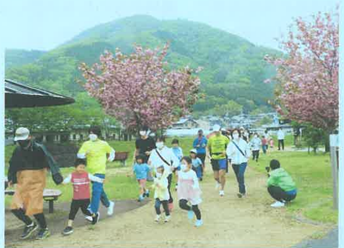
野間川芳田公園をスタート