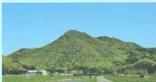
西から見た新緑の角尾山

芳田地域を代表する秀峰のである角尾山(標高344m 比高260m)の山頂に築かれています。山頂の主郭から南へ続く尾根に延長90mにわたって9段の曲輪が階段状に築かれ、その西側の縁に沿って通路が通っています。特徴的なのは、山頂の主郭に築かれた石垣積みの櫓台状の高台です。以上の点を総合すると、角尾山城は、小さな曲輪を連ねることから南北朝時代に原型が作られ、戦後時代に櫓台や通路が作られたとともに各曲輪の補強が図られたものと考えられます。このころの山城は合戦の時にこもるための城で、普段は見張り番がいるだけでした。そのため建物も粗末な小屋程度しかなかったようです。