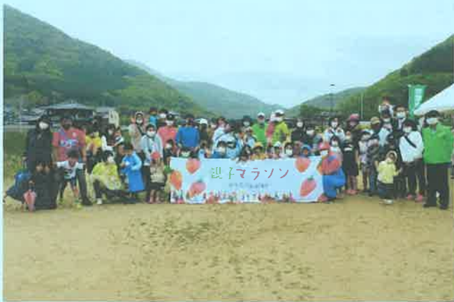
19組63人の親子が集合

芳田自治協議会では、これからも芳田地区外との交流をいろいろと企画していく予定です。