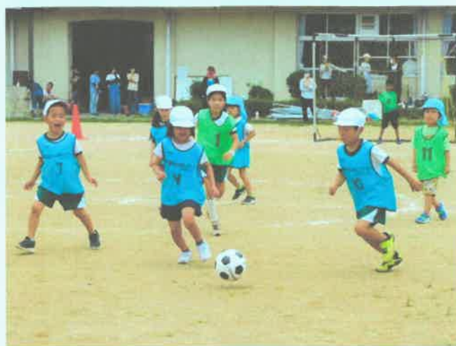
年長・低学年の部