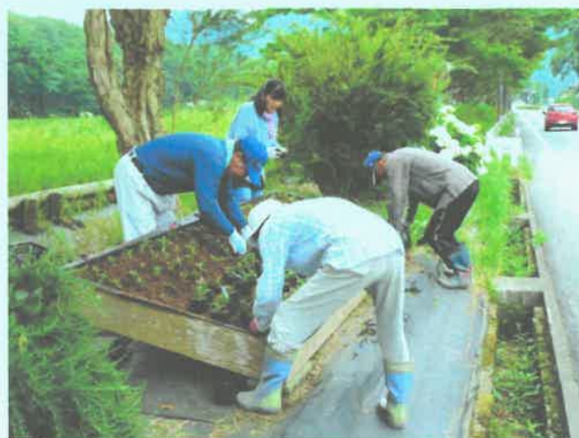
合山町の花壇に花苗を植える夢うさぎのみなさん

きれいに咲き誇った花を見ると、心が癒されます。これから楽しみです。ちなみにニチニチソウの花言葉は「楽しい思い出」「友情」「生涯の友情」だそうです。