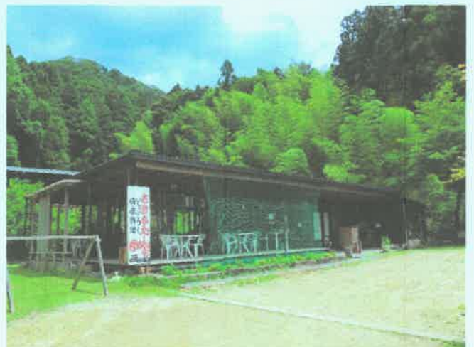
農家レストラン「土一七日屋台(どいなかやたい)」