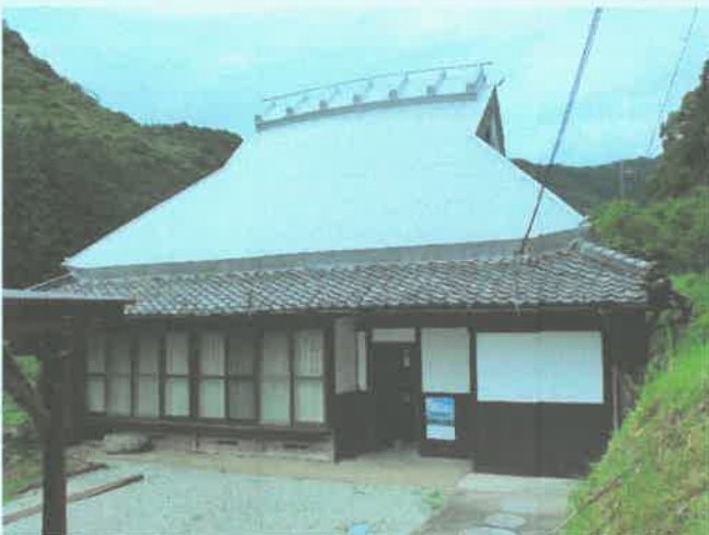
宿泊施設「大谷山荘1号館」

原始人会は加西市の最北端、上万願寺町にあり、過疎少子高齢化・鳥獣被害・嫁不足・・・といった課題を打破するため、自分たちの地域は自分たちで何とかすると集まったヤル気のある20～70代の男女で結成された団体です。田舎生活体験施設(再生古民家宿泊施設)である大谷山荘や農家レストランである土一七日屋台(どいなかやたい)を運営されたり、どぶろくを作られたりしています。