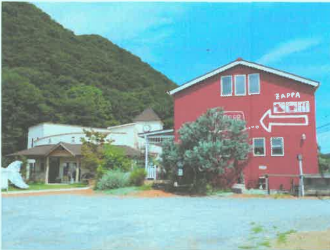
「ZAPPA 本店」(左)と「ざっぱこ」(右)

ザッパ村は姫路市西部の石倉地区にあり、自然素材を取り扱うアパレルショップ、アクセサリ雑貨やお花、カフェ2店舗や美容室やエステサロン、革製品、コーヒー焙煎所、就労継続支援事業所まで幅広く展開されています。