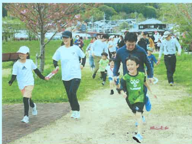
野間川芳田公園をスタート

4月16日(日)、いちごの里親子マラソンが開催されました。今回で2回目の開催。33家族122名の参加で、中には阪神方面から参加された方もありました。