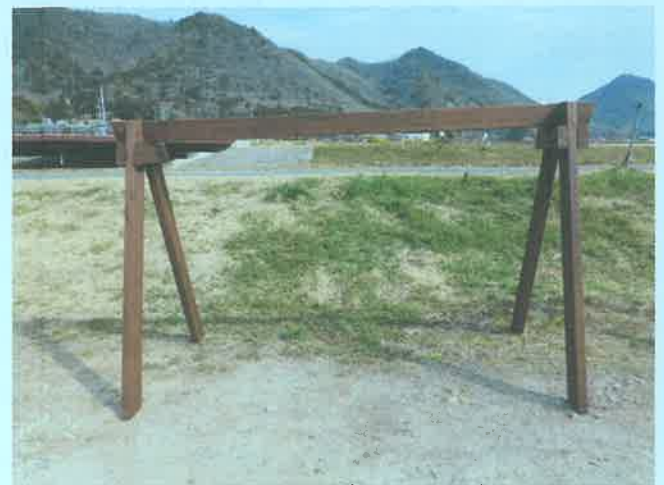
完成したサイクルスタンド

産業・観光部会の中に器用な方がいて、写真のようなサイクルスタンドを6台作製、いちご園などに設置しました。