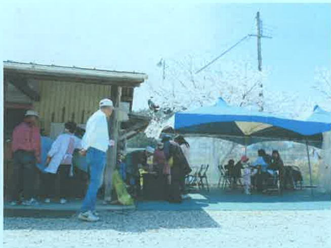
さくら祭りの様子

満開の桜の中、4月1日(土)、芳田ふれあい直売所でさくら祭りとふれあいBBQの集いがありました。ふれあいBBQには5家族21名の参加があり、子どもも大人もみんな楽しそうでした。