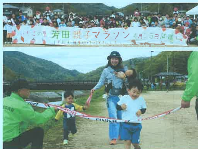
ゴール！ がんばった！