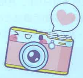
【部門賞・暮らし】 「採ったどーー!!」