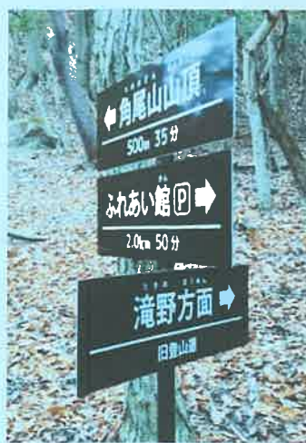
新道と旧道の分かれ目