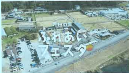
芳田の里ふれあいフェスタ 2022

11月6日(日)に開催された芳田の里ふれあいフェスタの動画が完成し、YouTube にアップしました。また、昨年春に実施した親子マラソンや角尾山登山道整備の様子を紹介する動画もYouTube にアップされています。それぞれ下の言葉で検索すれば、見るができますので、ぜひご覧になってください。