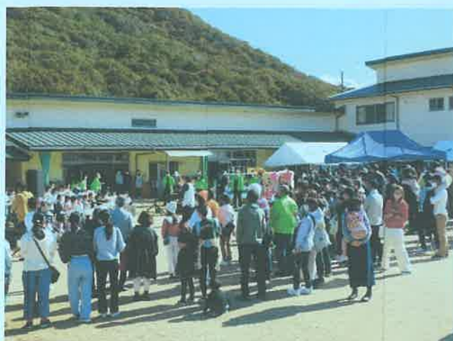
芳田こども園で開催した芳田の里ふれあいフェスタ

なお、来年度、クリーンキーパーと園外保育支援員に欠員が生じますので、芳田自治協議会では新たにクリーンキーパー、園外保育支援員を募集します。給料も支払います。ご希望の方は2月末までに事務局へご連絡ください。