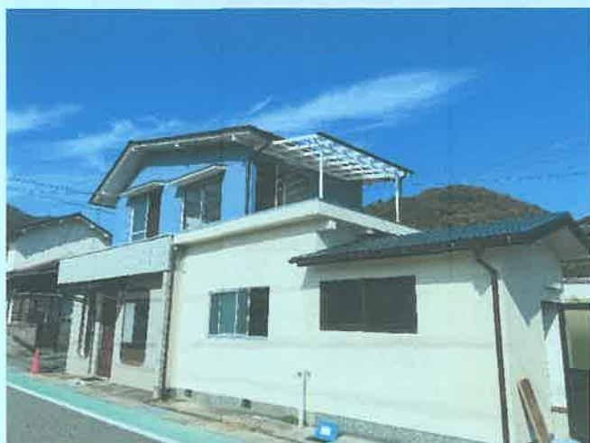
お試し移住住居の外観

今後は、より多くの方々に利用いただけるよう、都市圏でPR活動を行う他、さらに他の空き家も改修し、第2、3の拠点づくりをめざす計画です。(佐藤敬生)