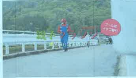
いちごの里親子マラソン 2022