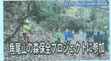
角尾山の森保全プロジェクト

YouTube の中で、芳田自治協議会関係以外に、角尾山、篠田いちご園、佐藤果実工房、かんばんラーメン、kissa dot.、ベリーベリーファーム、木谷山キャンプ場など、個人でアップされた動画も見つけました。YouTube に限らず芳田の魅力の発信に SNS はたいへん有効なツールです。芳田自治協議会でも芳田の魅力発信に努めていきますが、みなさんも個人で SNS を通して芳田の魅力をどんどん発信していきましょう。