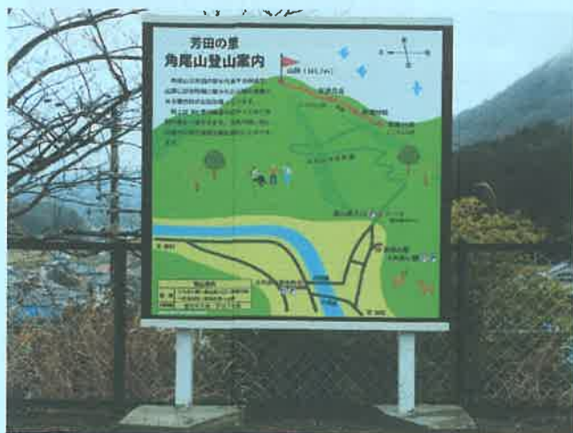
芳田の里ふれあい館に設置した案内看板

登山道に数か所案内看板を設置していますので、迷うことはありません。一度、登られてはいかがですか。山頂に記帳ノートを置いています。登山の感想等、自由にお書きください。