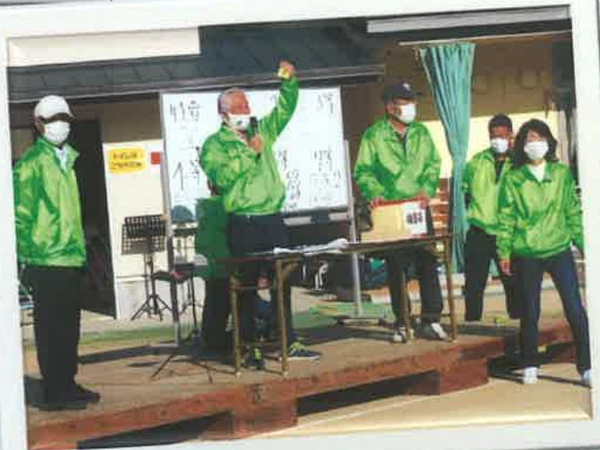
実行委員会の来場者目標は1000人。目標を軽く超え、実行委員長は大喜び。 用意した抽選券は999番まで。配った抽選券の最後は778番。ヒヤヒヤ。