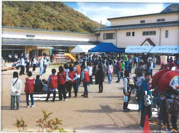
キレイのダンス。若いっていいなあ。 あのころに戻りたい (おっちゃんスタッフの感想)。