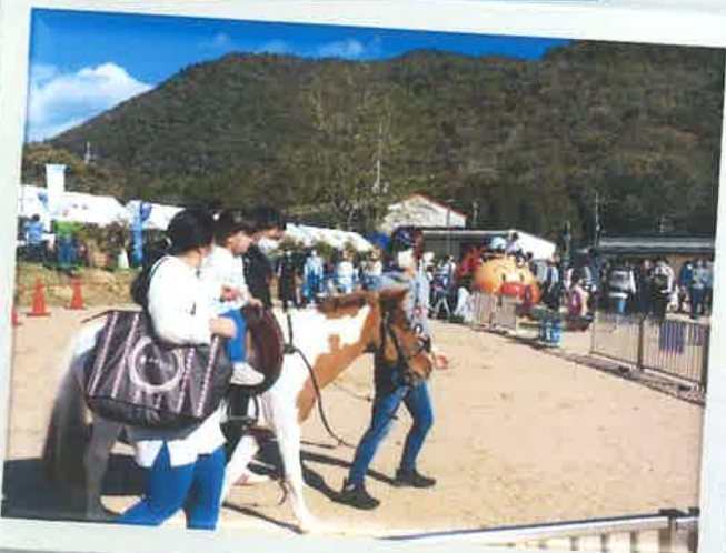
ポニー乗り場には長い列。 子どもたちにも楽しんでもらえてよかった。