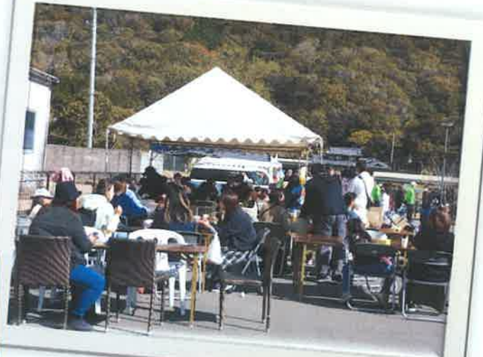
地元から多くの事業所、団体、 有志が出展・出店。 早くから売り切れ店が続出。