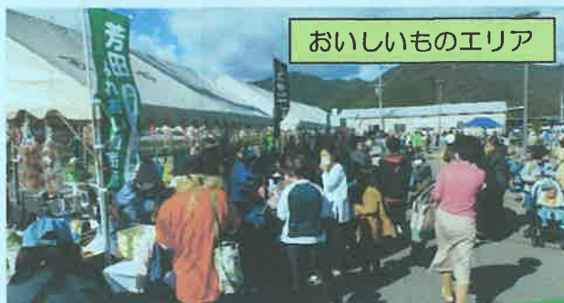
おいしいものエリア

芳田の里ふれあいフェスタは、出展・出店者や運営協力金を提供していただいた芳田地区内の事業所等、多くの方々に支えていただきました。ありがとうございました。