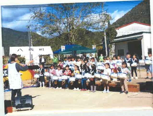
オープニングは芳田こども園 5歳児による鼓隊演奏。