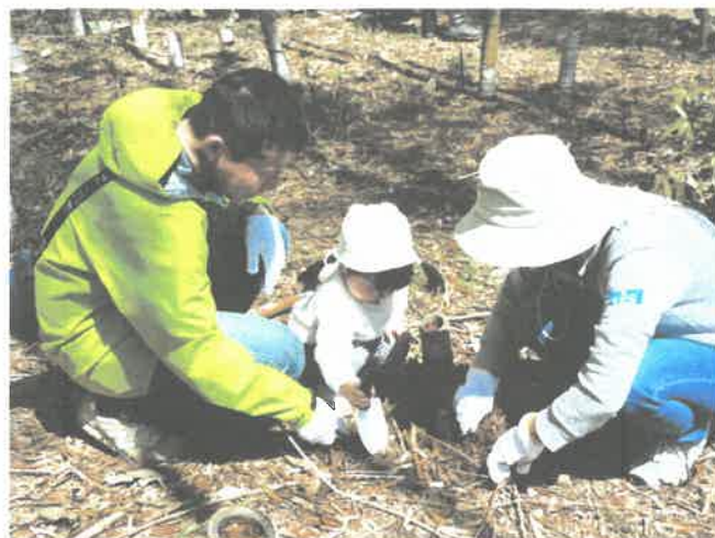
たけのこ掘りに挑戦