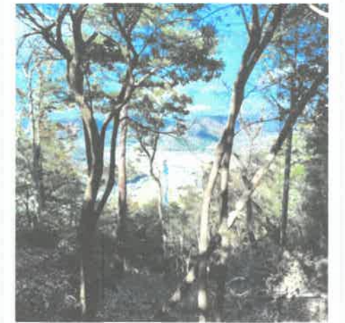
「角尾山頂上手前より望む野間川」