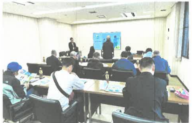
奈義町視察の様子