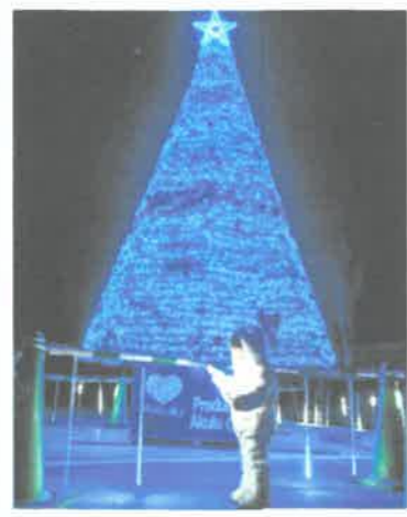
「芳田イルミネーション」