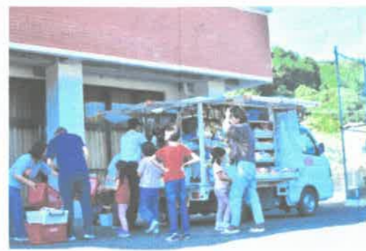
「楽しいお買い物」 uchihashi さん