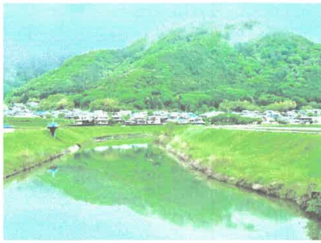
「新緑の芳田」 little_raccon.27 さん