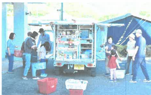
会話も弾む移動販売

移動販売のよいところは、歩いて行けて、現物を見て買い物ができるということだけではありません。そこに集まった者の会話が生まれることも大きな利点です。小さな子どもが近所のおばあちゃんに話しかける、そんなほほえましい姿が見られてよかったです。