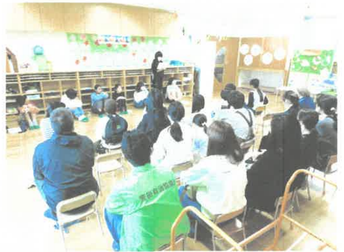
7名それぞれが自分の考えを発表