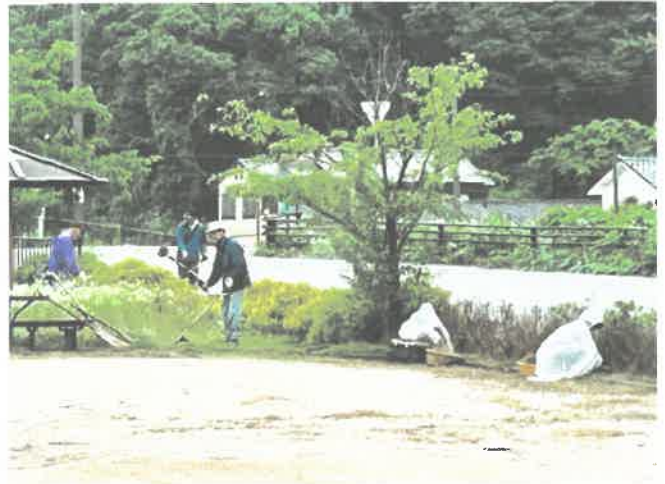
芳田地区老人会の作業の様子

この野間川芳田公園については、みんなが気持ちよく活用できるよう、年4回、草刈り、草引き等をして維持管理に努めています。4月21日(日)には芳田地区区長会が、6月30日(日)には芳田地区老人会が草刈り、草引き等をされました。今後、芳田自治協議会と落方町・明楽寺町・水尾町の3町がそれぞれ同様の作業をする予定です。