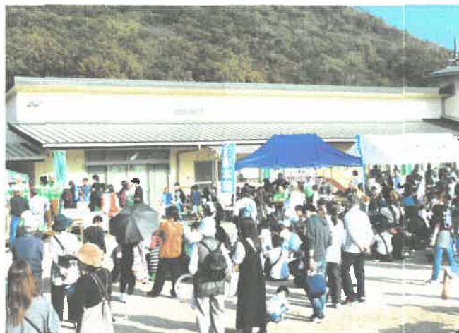
昨年の芳田の里ふれあいフェスタ