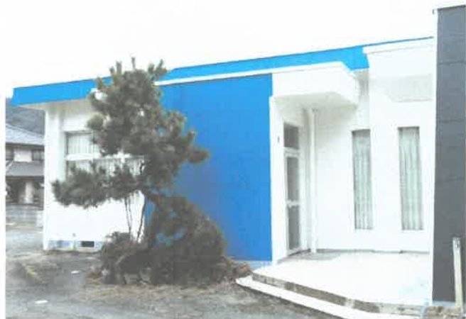
旧水尾町公民館玄関