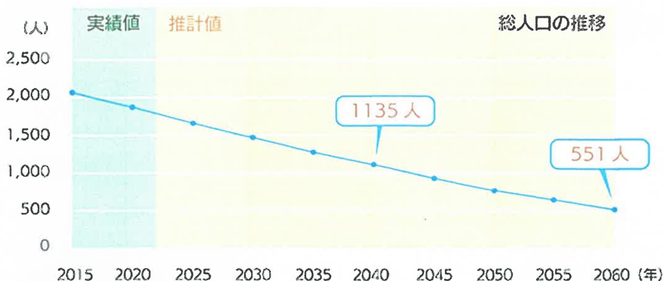
芳田地区の総人口の推移

参照) 名古屋大学大学院環境学研究科附属持続的共発展教育研究センター 簡易人口推計ツールより