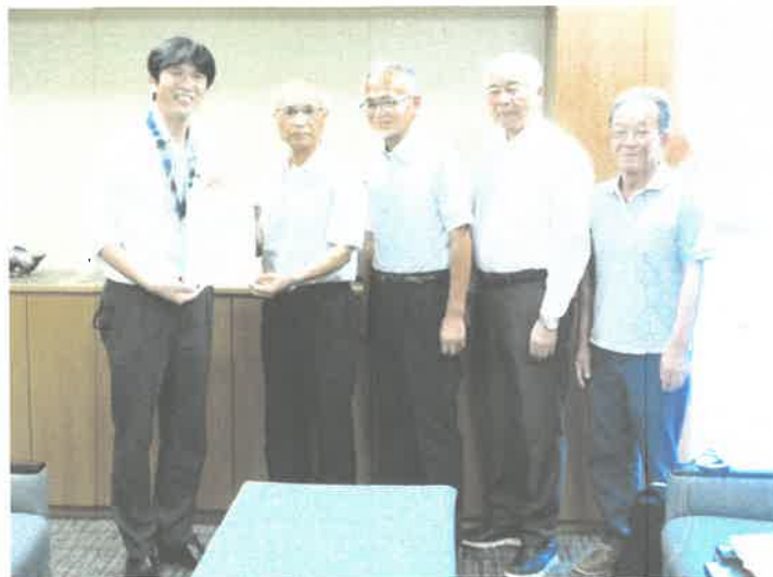
市長に要望書を提出