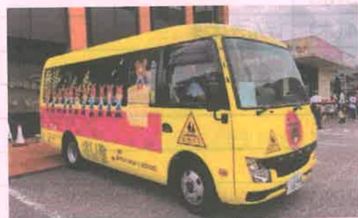
こども園のバスも新しくなりました