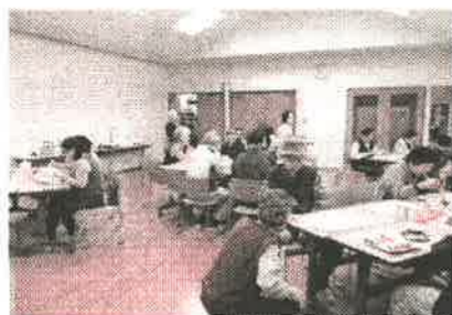
声を掛け合って団らん