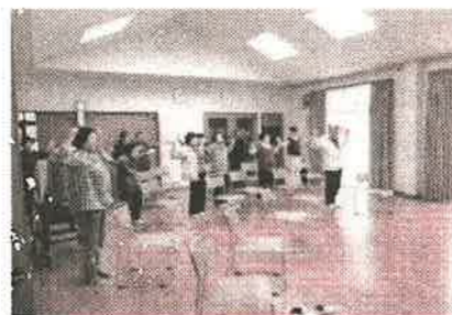
おり姫体操で筋力維持