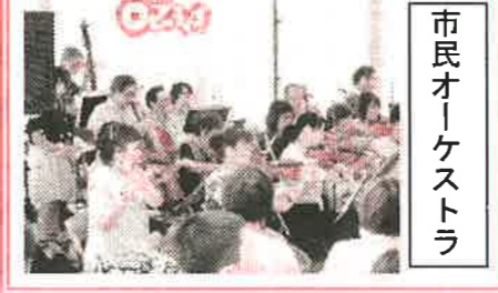
市民オーケストラ

「みんなの音楽会」 近隣の福祉施設で活動している人を対象に小野市で「みんなの音楽会」が有りました。素敵な歌声やハーモニーで心を和やかにすると共に、音楽に合わせて一緒に歌ったり身体を動かしたりして楽しみました。