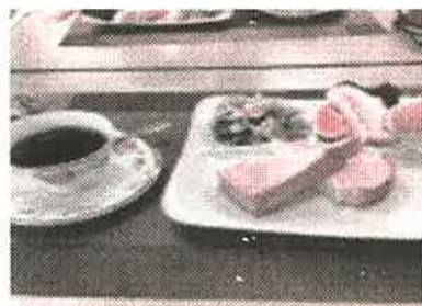
本格的なコーヒーセット

無事オープンできるか不安もあったが、毎回多くの皆さんから「毎月楽しみにしている」との声を聴き「ホッ」としている。