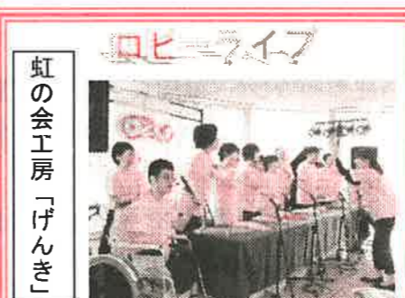
虹の会工房「げんき」

「みんなの音楽会」 近隣の福祉施設で活動している人を対象に小野市で「みんなの音楽会」が有りました。素敵な歌声やハーモニーで心を和やかにすると共に、音楽に合わせて一緒に歌ったり身体を動かしたりして楽しみました。