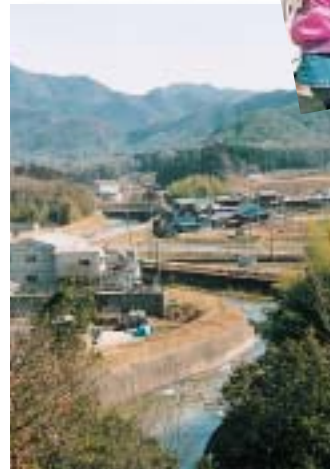
水・緑などの自然を生かして...