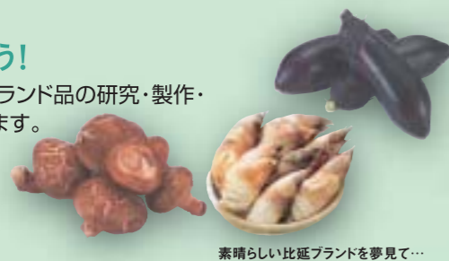
素晴らしい比延ブランドを夢見て...