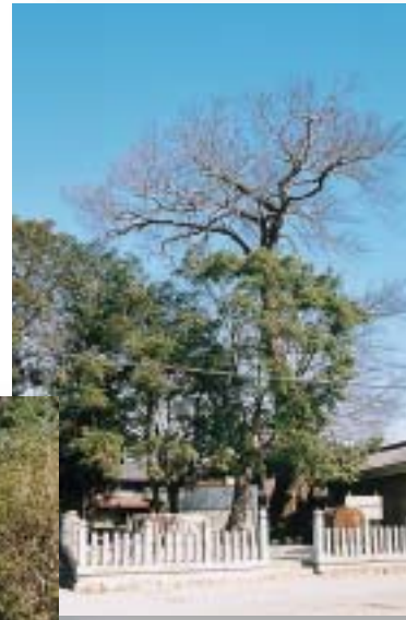
歴史遺産を大切にまもる