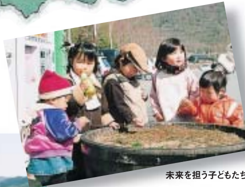
未来を担う子どもたち