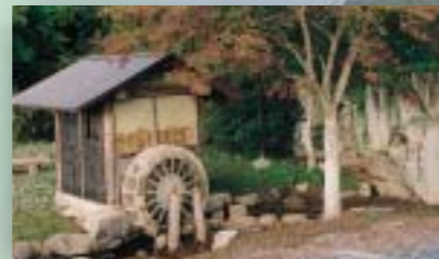
比也野里まちづくり委員会の手によって設置された水車小屋