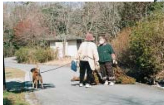
日々のふれあいの中から