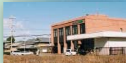
閉鎖となった農協をまちづくりの拠点に...

注)3,4,5については平成20年までには実施できるよう有志を募り検討していきます。