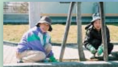
比延小学校前の道路で美化活動