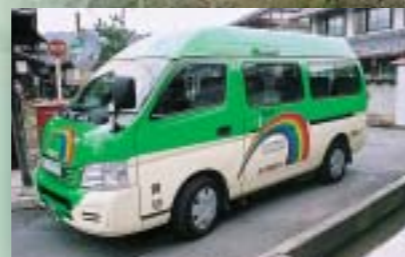
お年寄りの皆さんの新たな交通手段を検討します