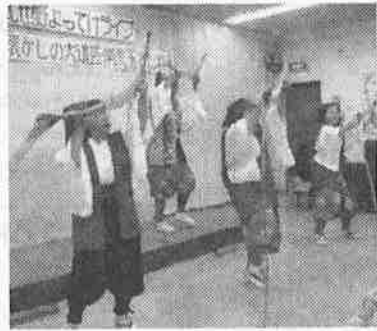
南京玉すだれ「若竹会」さんの公演

第三十四回 比也野よってけライブ 懐かしの大道芸 南京玉すだれ 六月十七日 開催される