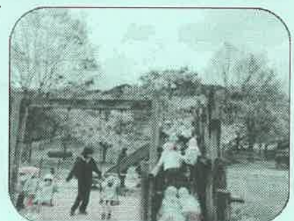
<春の遠足の一コマ>

お家の方が、一生懸命つくってくださったお弁当の味はどうだったかな? 新入園や転園児も、少しは慣れたかな?