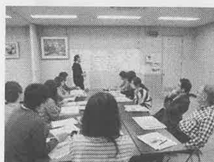
(黒田庄まちづくり協議会)