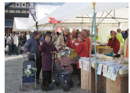
黒っこふれあい広場（軽トラ市）