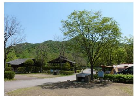
日時計の丘公園(キャンプ場)