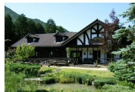
フォルクスガーデン