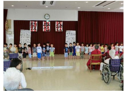
高齢者と子どもの交流