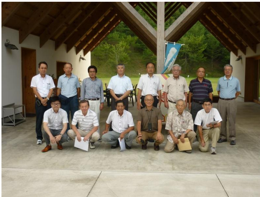
「まちを再発見しよう」(8月)を終えて記念撮影