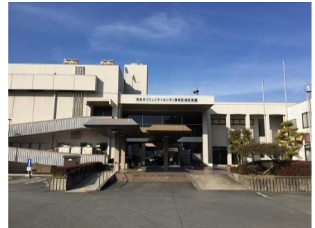
コミセン（黒っこプラザ）