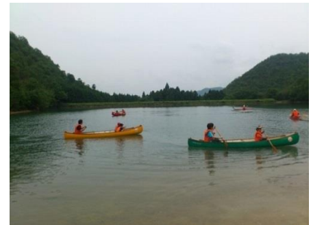
カヌー教室（秋谷池）