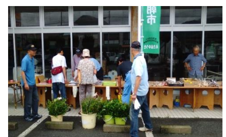
あつまっ亭（移動朝市）