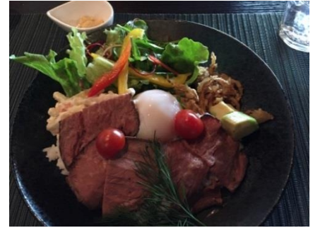
黒田庄和牛のローストビーフ