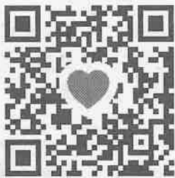
詳細やスケジュールがスマートフォンで確認できます

英語で「へそ」という意味。ママから赤ちゃんへ栄養を送るへその緒のように学びを通じて人と人を繋ぐそんな場所を日本のへそ西脇市からつくりたい、そんな思いからベリーボタンは誕生しました。