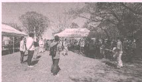
広場ではへそでちやの筍ごはん、筍の天ぷら 鹿肉バーベキューでおもてなし

四月二十日(土)晴天のなか高嶋町のご協力を頂き公民館横の広場において「たけのこ収穫祭」を行いました。西脇市観光協会と地域まちづくりのメンバー、たけのこオーナー、市役所のかぐや姫みつけ隊の方々と一緒に市外の愛好会の皆様方を迎えての