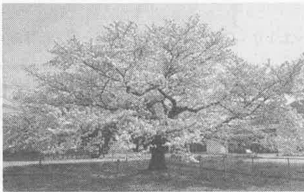
神戸新聞でも紹介された「夫婦桜」。撮影は4月7日