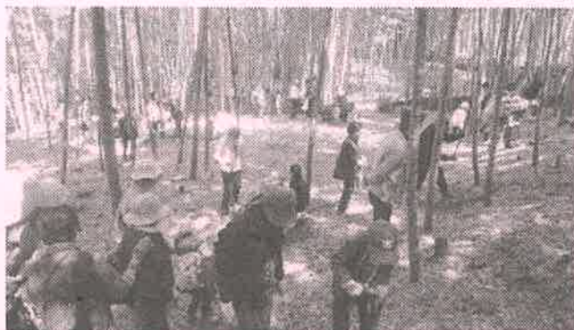
家族連れや市外からの参加者で賑わう竹林