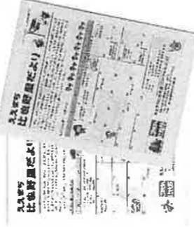
ええまち比也野里だより