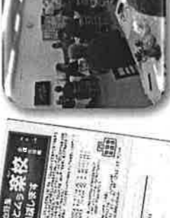
まちづくりアドバイザーと共に地区課題の洗い出しを実施