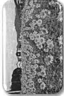
休耕田などを利用し、菜の花やひまわりなどの景観植物を植え、見所をつくります。