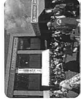
比也野まわりのメインイベント“フォーカダダンス”の様子