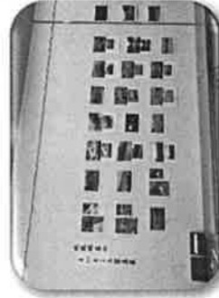
比延地区のよいところ写真選出作品をカレンダーに