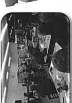
比也野里歴史講演