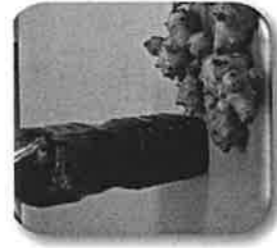
キクイモなど地元特産品を使った万能だれ