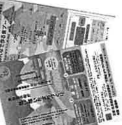
活動拠点“こみせん比也野”