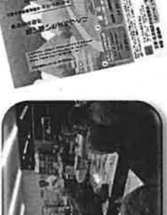
黒田庄地区と合同で地域自治協議会設立記念フォーラムを実施