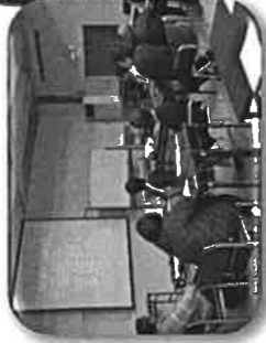
人材育成講座“ひとムラ楽校”楽しく学べる講座を実施しています。