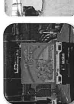
移動販売車 “笑顔いっぱい比也野号”での買物支援