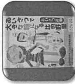
比延地区の子どもを守る会のポスター