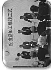
特産加工品の加工場を整備しました。“万能だれ比也野”の増産や、特産加工品の商品化を通して6次産業化にも取り組めます。