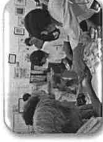
西脇工業高校家庭部の生徒たちが、ハそでちゃで作りのピザを販売しました。