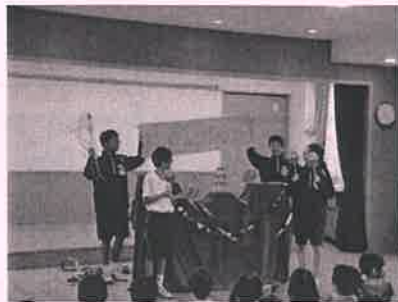
「比延こども園」にて