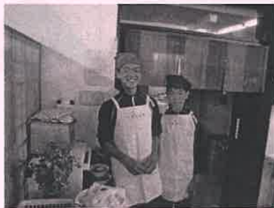
「ええまち比也野里」にて