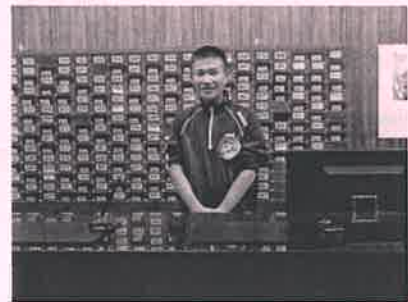
「西脇カントリークラブ」にて