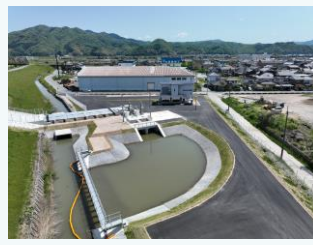
福田排水機場の整備(豊岡市)