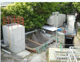
又兵衛抽水場の整備(尼崎市)