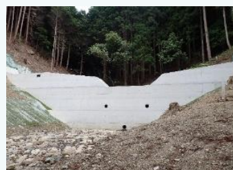
治山ダムの整備(兵庫県)