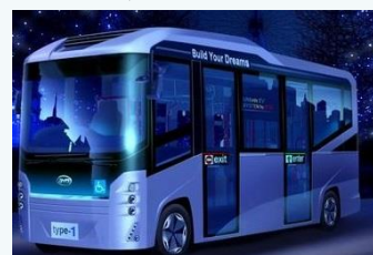
電気バスの導入 (南あわじ市)