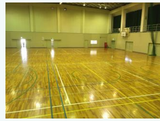
東条第一体育館の空調導入 (加東市)