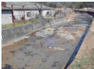
上比延谷川の土砂撤去(西脇市)