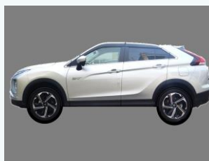
プラグインハイブリッド車の導入 (三木市)