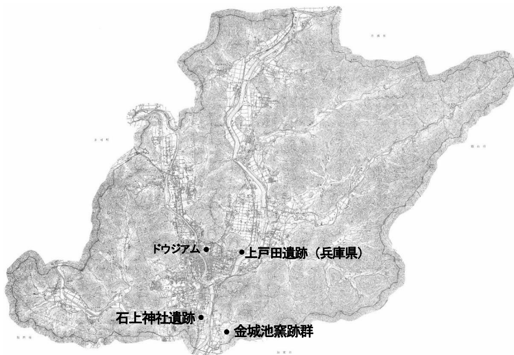
令和5年度埋蔵文化財発掘調査箇所 位置図