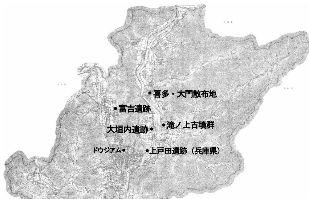
令和4年度埋蔵文化財発掘調査箇所 位置図