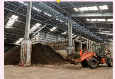
自然にやさしい農業の推進