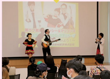
みらフェスの開催 地域子育て事業などこどもプラザの取り組み 図書館図書充実