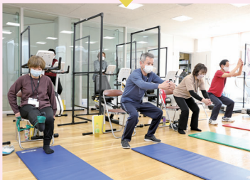
健幸運動教室Ni-Coの実施