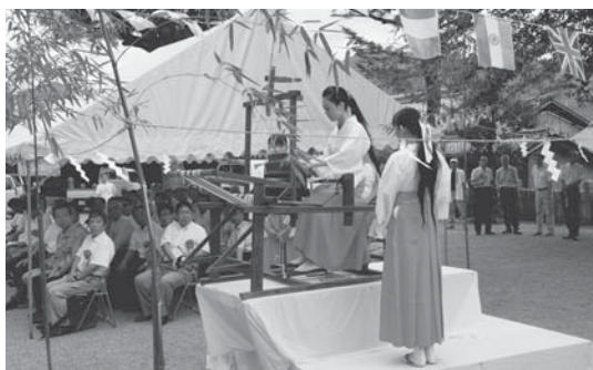
地場産業「播州織」をたたえる織物感謝祭

問 ブランドをしっかりと構築するためには、デザインに徹底的にこだわってみることが必要だと考える。それに対する現在の市の、経済振興及び観光資源的部分としての認