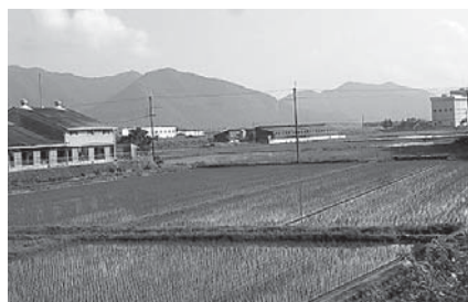
牛舎前に広がる水田

答 国県の助成制度、西脇市独自の助成制度は。助成制度には、青年就農給付金や農の雇用制度等がある。また、本市としては、スイーツファクトリー支援事業に加え、今年度は、農業インターンシップ事業を実施し、農業を志す若者の農業体験を実施する。