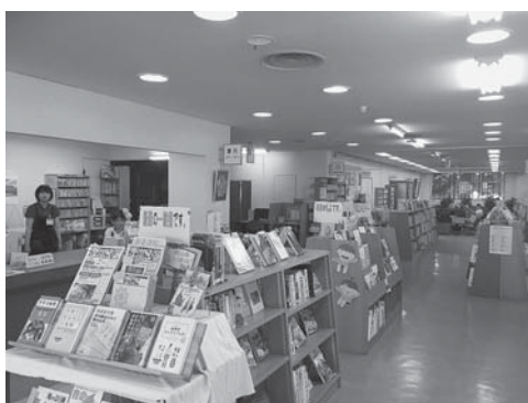
茜が丘へ移転する現図書館

問 生活文化総合センターとしての継続的な活用を前提に、子どもから高齢者までが憩いの場として活用できる市民サロンの機能も兼ね備えた施設として、有効な活用を検討する。