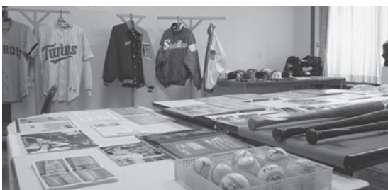
「今里純野球展」の風景