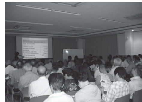
80名を超える参加のあった芳田地区

各会場で行われましたご質問等の回答やアンケート分析結果は、第10回議会報告会報告書として市議会HPに掲載いたします。また、次回11月開催予定の議会報告会各会場での配布も予定しています。