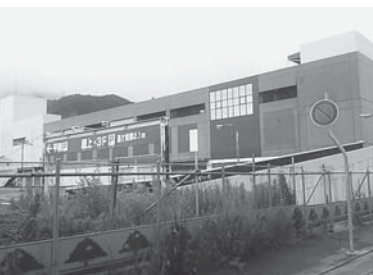
第一染工とカナー跡地