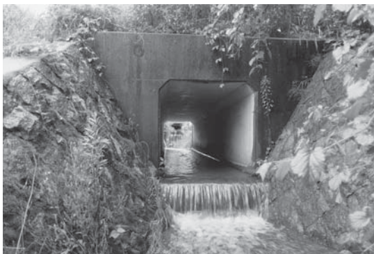
逆流止めの必要な排水路

問 津万地区の垣内地域（比延地区から緯度橋を渡った右方面）で、平成16年、23年の大雨により被害が発生している。大水が発生した時