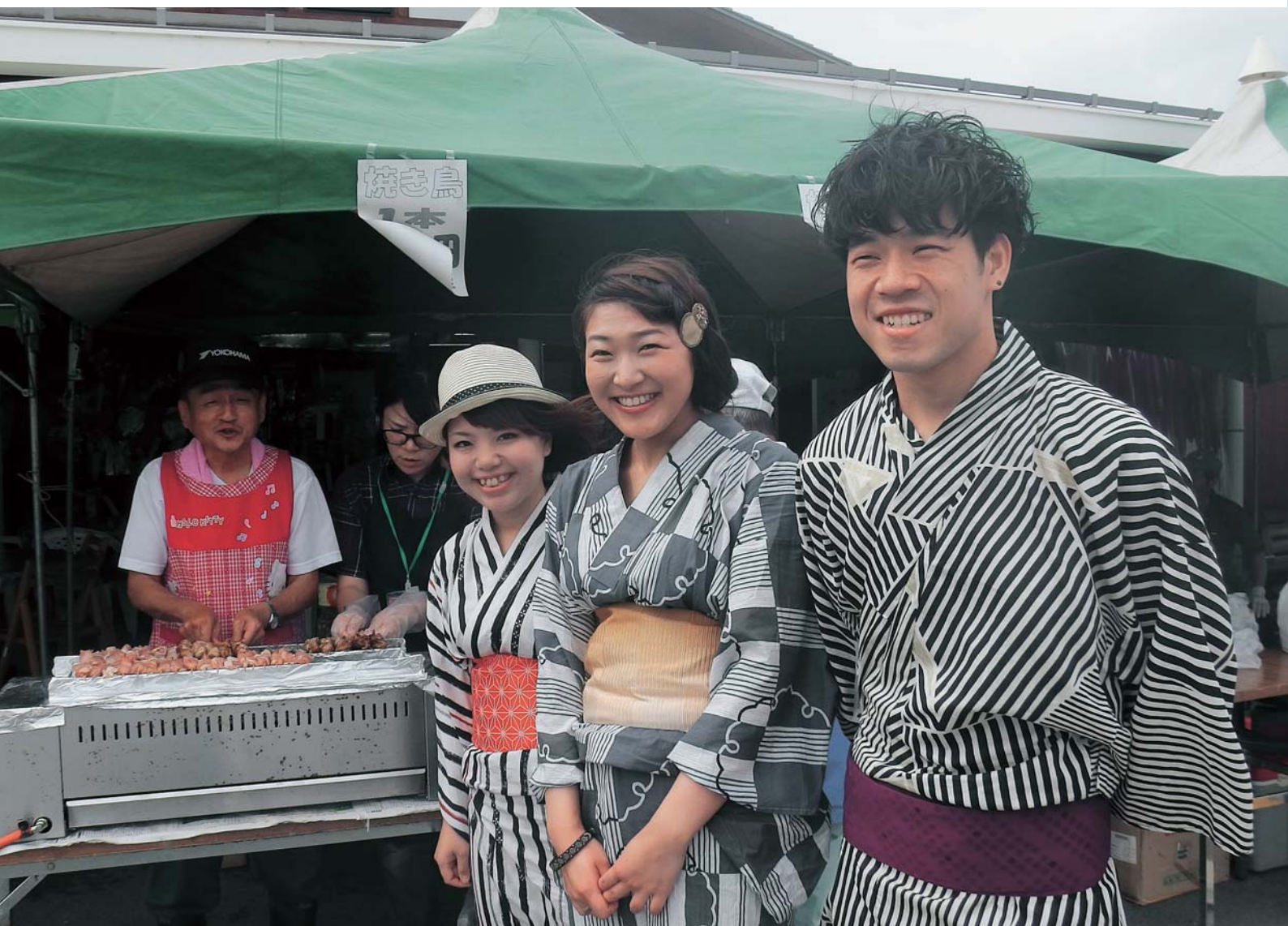
ありがとう4周年 旬菜まつり（北はりま旬菜館）

発行／兵庫県西脇市議会 編集／議会広報編集特別委員会 西脇市郷瀬町605 TEL (0795) 22-3111 FAX (0795) 22-4301