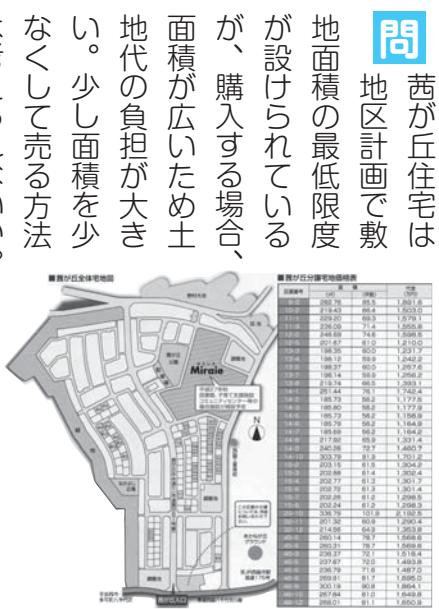
43区画残っている茜が丘分譲地

問 勤労者住宅資金融資は2千万円（茜が丘は3千万円）が設けられているが、利率は考えられないか。