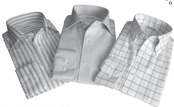
商品化が進む播州織