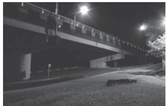
夜の「へそ公園駅」周辺

答 不審者情報や犯罪発生マップ等の防犯に関する情報を、もともとホームページ上に公開するべきである。市の犯罪情報の周知や防犯対策の取組について、