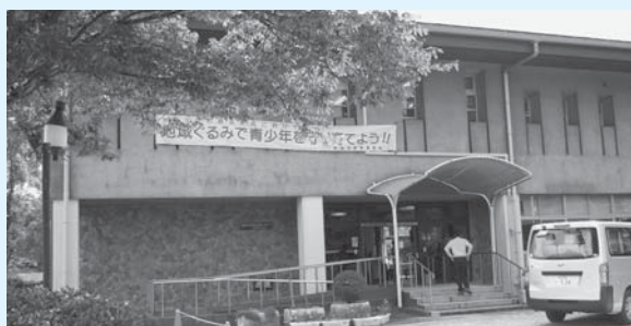
勤労福祉センター

て利用者も多く、耐震診断を行い、必要があれば耐震補強して存続使用。 ⑦ 日野地区会館 まちづくりの拠点として利用されている。必要があれば耐震補強して存続使用。 ⑥ 勤労福祉センター 当初の目的は終わっており、老朽化のため廃止すべきだが、生活文化総合センター、童子山公園の総合的な計画の中で判断する。