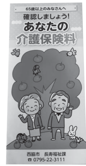
介護保険料ハンドブック