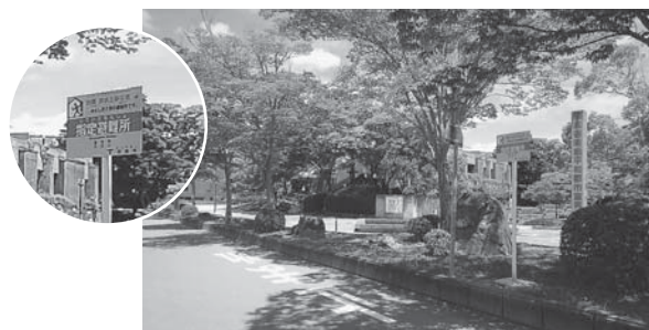
指定避難所である総合市民センター

問 中学校教科書採択の時期を迎えている。絞り込み等の不審を抱かれないためにも採択決定に至る過程を公表する必要がある。どのようにして公表するのか。 答 教科書採択は、各市町の教育長6名