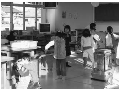
▲比延小学校 のびのびクラブ

色々な回答が寄せられている。この問題についての見解と、本人の特定も含め、今後の取り組みについて聞く。 答 インターネット上に匿名により差別的な書き込みをすることは、重大な社会問題であり、著しい人権侵害を引き起こしていると思っています。今後も、このような問題が起きてはいけなさと認識してい