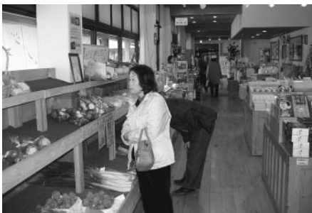
▲道の駅特産品販売コーナー

問 農業の振興と特産物の育成は、市のイメージアップに直接つながる重要施策。地場産業に特産品のイメージを付加し、市のアイデンティティを豊かなものにしていくべき。①地産地消を推進すること②農業特産品をまちづくりの主要な柱とすること③有機・減農薬を基本として独自の認証制度を設けること、が大切だ。例えば高嶋町の筍の竹林を守