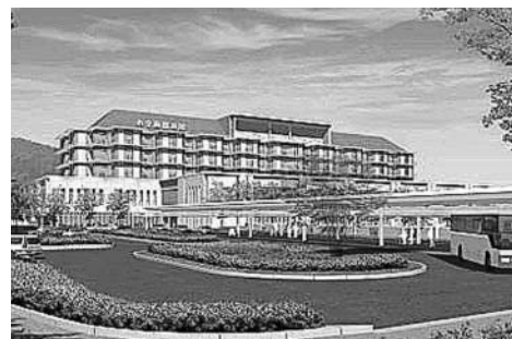
▲新病院完成予想図

周産期の診療科を持つ病院となり、新病院になってもがん治療や循環器の充実を目指し、できる限り専門科の中では、地域完結型の役割を果たせる病院にしていこうと思つています。②顧問や院長等の人脈を通じ、関連大学以外の医局にも医師派遣依頼を行うなど確保に努めています。医師の負担を軽くし、医師本来の業務に専念できるよう、より働きやすい職場環境や処遇の改善等を図るため、軽減策を募り実施しています。③退院調整や相談窓口、紹介患者の受