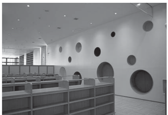
「みらいえ」に開設される新図書館

「子ども子育て支援を確立する」は、子どもたちが本に親しむ絶好のチャンスである。子どもたちや、中学・高校生へのアプローチの考えは。また、学校教育の力や、学校教育の力や、キュラムに取り入れることはできないか。