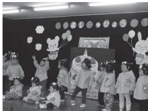
比延保育園の学芸会風景

していましたが、お金の流れ(当初予算・きとの考えから、今定例会より「予算決算員で構成)で審査することになりました。平成27年度当初予算及び主要施策・平成26わか4月号No124]をお読みください。