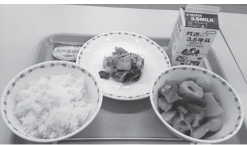
西脇市のある日の学校給食

子どもたちの食の安心・安全のためにも、農業振興のためにも、市は食材の地産地消率アップに取り組んでいるが、現在低下傾向にある。今後の対策は。平成27年度に、出荷者意向調査を実施し、学校給食用野菜における生産体制の再構築を図る。また、学校給食出荷奨励に係る支援等を検討し、学校給食における地元産の安心・安全な食材の確保と地産地消率アップに努める。