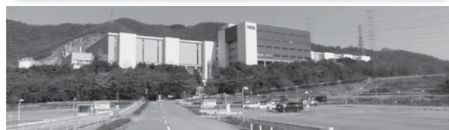
タワージャズジャパン(株)