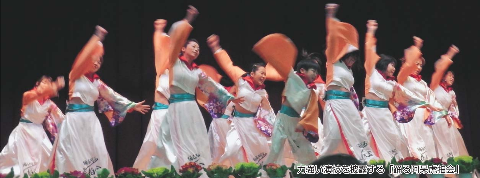
力強い演技を披露する「踊る阿呆虎拍会」