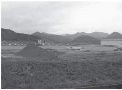
建設が進む太陽光発電設備