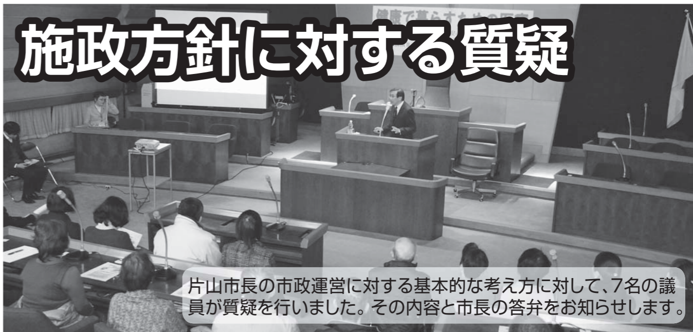
片山市長の市政運営に対する基本的な考え方に対して、7名の議員が質疑を行いました。その内容と市長の答弁をお知らせします。