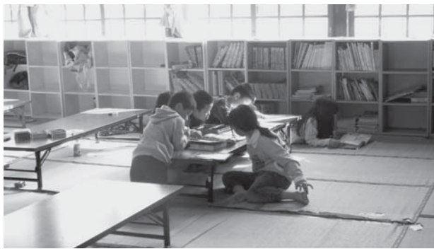
西脇小学校の学童保育風景