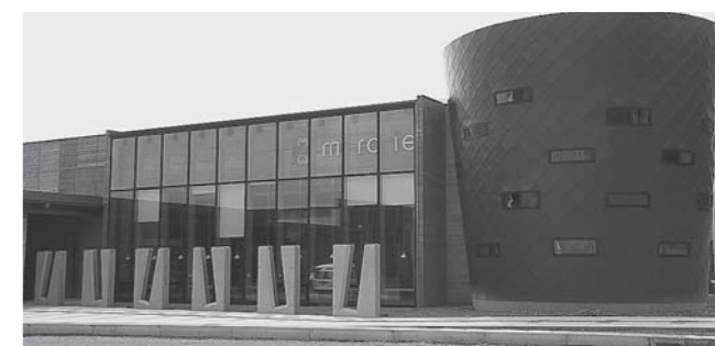
茜が丘複合施設「みらいえ」