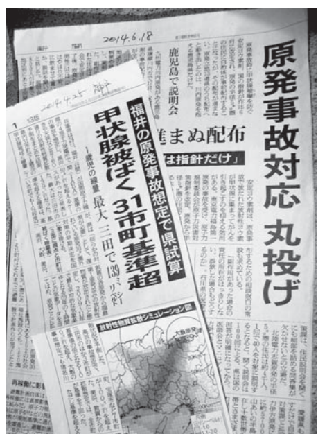
避難計画に疑問を提する記事

福井県若狭町鳥羽小学校区の住民1,840人を受け入れる計画である。受入施設は、黒っこプラザ、黒田庄体育センター、黒田庄福祉センター、総合市民センター、勤労福祉センターである。汚染度の検査や除染は、避難元の福井県が実施する。