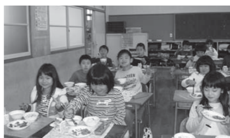
重春小学校2年生 おいしそうな給食

答 学校給食法で給食に必要な経費のうち光熱水費等については、保護者又は設置者の負担ということになっている。しかし、県下29市の中で保護者負担としているところが非常に少ないとい