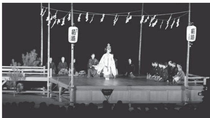
市制5周年に開催された観月新能

判断した。西脇市は県下でも文化度が高いまちと言われている。その理由をどう認識しているのか。また、市長が思われる文化とは何か。本市では、昭和32年に県下でいち早く文化連盟が結成された。それ以降、東播磨・北播磨の地域文化の発展の牽引役として大きな注目を集め、現在に至っている。文化とは、市民の生きとし生ける活動全てが文化である。「まちの息吹」