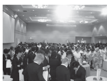
成人式でにぎわうホール

は行わなかったのか。なぜ、民間企業に援助しなくてはならないのか。 答 再開発事業として他の地権者とともに共同で事業を実施したので、金銭的な支援