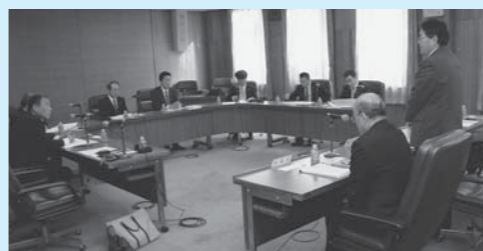
ひたちなか市議会