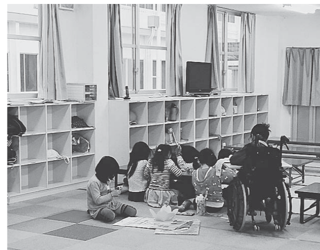
重春小学校学童保育室「ともだちクラブ」