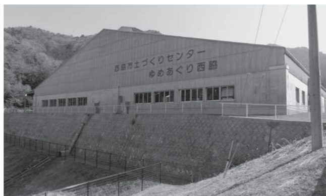
土づくりセンター「ゆめめぐり西脇」