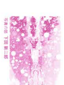
デザインの一部 坂本 ゆかり