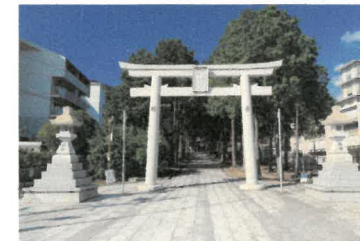
⑦ 八幡神社 <クイズのヒント> 拜殿右手の案内板を見よう

昭和9(1934)年から11(1936)年にかけて建設された現在の木造校舎は、平成20(2008)年兵庫県景観条例に基づく景観形成重要建造物になる。映画「火垂るの墓」、「人間失格」の撮影が行われた。西脇地区、津万地区の児童約400人が通う。平成29(2017)年度より大規模改修を実施