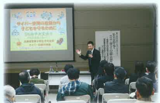
市民人権セミナー