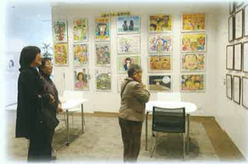
小中学生人権標語・人権ポスター