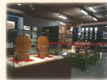
定住自立圏特別展