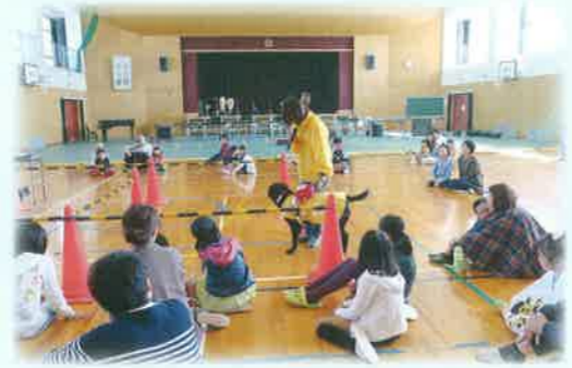
にしわきっ子人権教室(盲導犬学習)