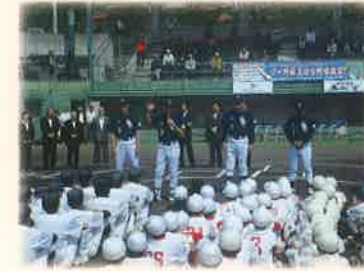
市制10周年記念事業プロ野球名球会野球教室