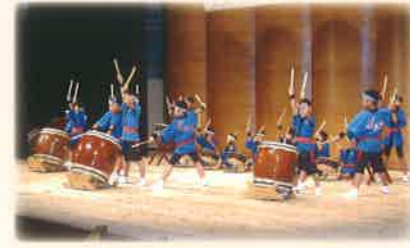
子ども芸術祭・子どもステージ