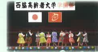
西脇高齢者大学学園祭