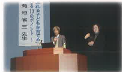
PTCA西脇研究大会(家庭教育の啓発)