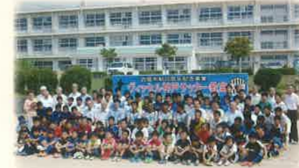
市制10周年記念事業ヴィッセル神戸サッカー教室