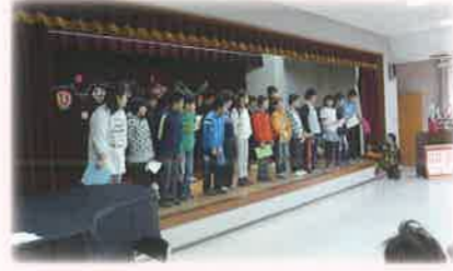
ふれあい交流及び共同学習(ひなまつり会)