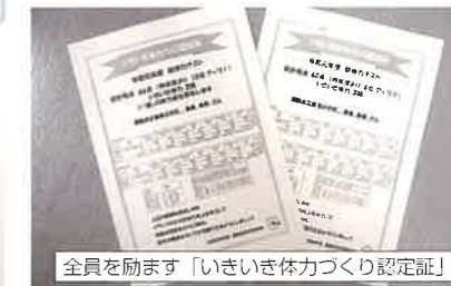
全員を励ます「いきいき体力づくり認定証」